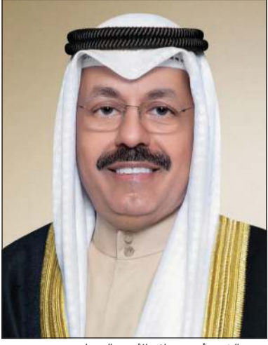
سمو الشيخ أحمد نواف أحمد الصباح

بعث رئيس مجلس الوزراء سمو الشيخ أحمد نواف أحمد الصباح ببرقية تهنئة إلى الرئيس د.عارف علوي رئيس جمهورية باكستان الإسلامية بمناسبة العيد الوطني لبلاده.