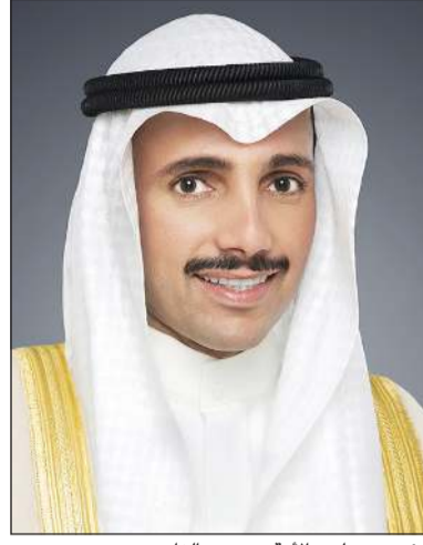
رئيس مجلس الأمة مرزوق الغانم

بعث رئيس مجلس الأمة مرزوق الغانم ببرقية تهنئة إلى كل من رئيس الجمعية الوطنية في جمهورية باكستان الإسلامية راجه برويز أشرف ورئيس مجلس الشيوخ محمد صادق سنجرائي، وذلك بمناسبة العيد الوطني لبلدهما.