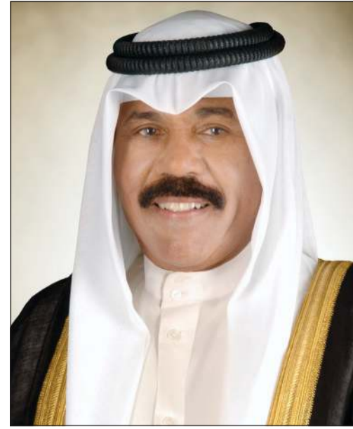
صاحب السمو الأمير الشيخ نواف الأحمد

جمهورية غيانا التعاونية الصديقة، عبر فيها سموه عن خالص تهانيه بمناسبة العيد الوطني لبلاده، متمنياً لجلالتة وأفر الصحة والعافية ولبروناي دار السلام وشعبها الصديق كل التقدم والازدهار.