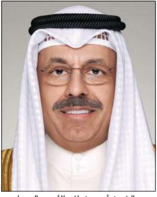
سمو الشيخ أحمد نواف الأحمد الصباح

بعث رئيس مجلس الوزراء سمو الشيخ أحمد نواف الأحمد الصباح ببرقية تهنئة إلى السلطان الحاج حسن البلقية سلطان بروناي دار السلام الصديقة بمناسبة العيد الوطني لبلاده. كما بعث رئيس مجلس الوزراء سمو الشيخ أحمد نواف الأحمد الصباح، ببرقية تهنئة إلى الرئيس د.محمد عرفان علي رئيس جمهورية غيانا التعاونية الصديقة بمناسبة العيد الوطني لبلاده. كما بعث رئيس مجلس الوزراء سمو الشيخ أحمد نواف الأحمد الصباح، ببرقية تهنئة إلى الإمبراطور نارو هيتو إمبراطور دولة اليابان الصديقة بمناسبة ذكرى ميلاد جلالتة.