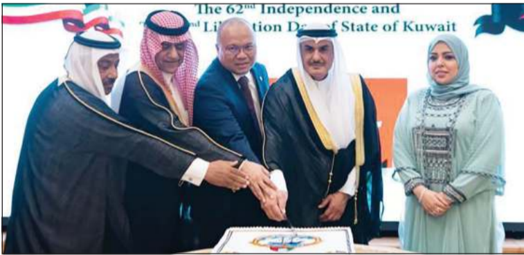
السفير صلاح المطيري يشارك السفراء المعتمدين في بروناي قطع كعكة الاحتفال