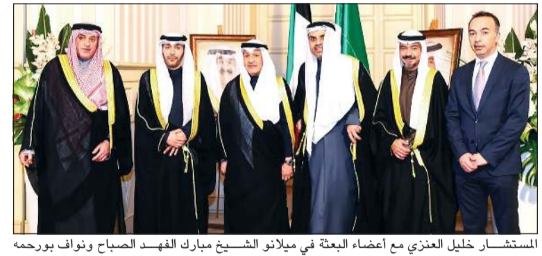
المستشار خليل العنزي مع أعضاء البعثة في ميلانو الشيخ مبارك الفهد الصباح ونواف بورحمه وعبدالكريم الأصفه وأحمد الخبيزي والسكرتير يوسف البينوان

الأجنبي في ميلانو ولومبارديا كانوا في مقدمة المهنيين من بين كبار المسؤولين ورؤساء وممثلي الإدارات المحلية والبرلمانية والشخصيات البارزة. كما شارك في الاحتفال رؤساء وأعضاء السلك الدبلوماسي بالبعثات العربية والأجنبية المعتمدة بالمدينة وشخصيات اجتماعية واقتصادية بارزة وبرلمانيون ورجال أعمال وأكاديميون وأعلاميون وفود من الجاليات العربية والإسلامية في شمال إيطاليا وأصدقاء القنصلية.