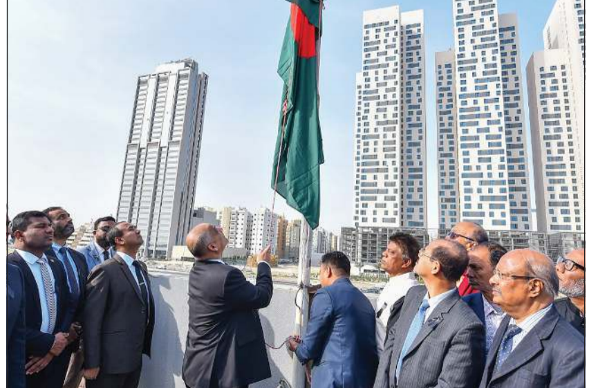
السفير اللواء ام دي عشيق الزمان والحضور خلال رفع العلم

العشرين للجمعية العامة للأمم المتحدة في 25 سبتمبر 1974 لتقديم اللغة البنغالية إلى العالم. وذكر عشيق الزمان أنه بسبب الإرادة