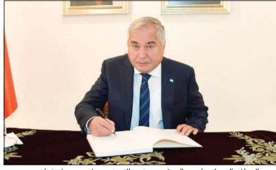
عميد السلك الدبلوماسي السفير دزيبده زبيدوف يسجل تعازيه