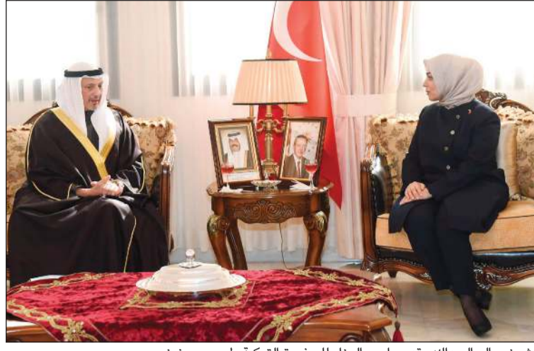
الشيخ سالم العبدالله يقدم واجب العزاء للسفيرة التركية طوبى سونمز