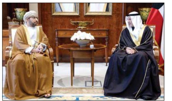
وزير الخارجية الشيخ سالم العبدالله مستقبلاً سفير سلطنة عمان د. صالح بن عامر الخروصي