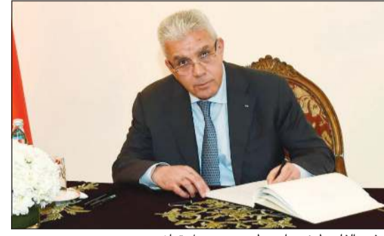
السفير الفلسطيني رامي طهوب يسجل تعازيه