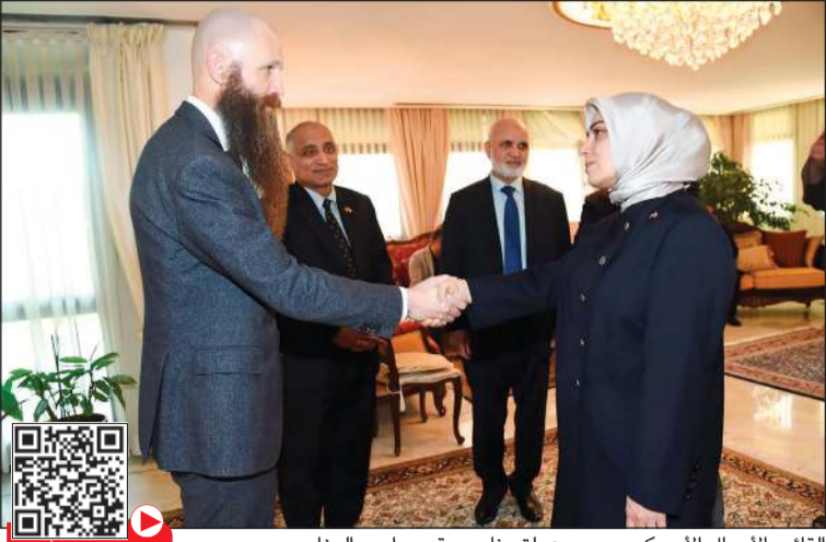
القائم بالأعمال الأميركي جيمس هولستنايدر يقدم واجب العزاء بضحايا الزلزال