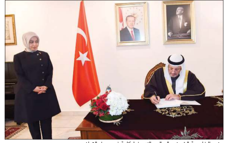
وزير الخارجية الشيخ سالم العبدالله يخط كلمة في سجل التعازي