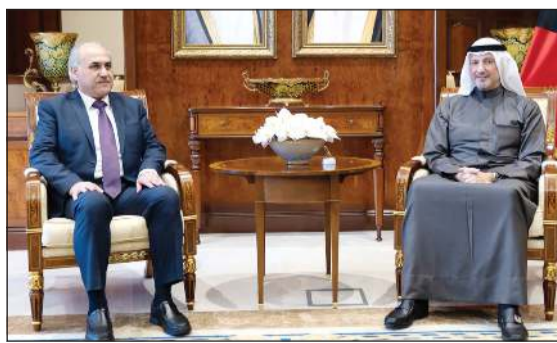
وزير الخارجية الشيخ سالم العبدالله مستقبلاً أمين سر مجلس النواب اللبناني مادي أبو الحسن