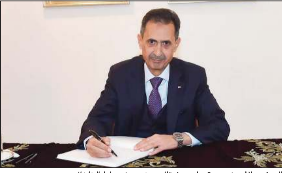
السفير الأردني صقر أبو شتال يعزي بضحايا الزلزال

وأوضحت ان رسائل التضامن التي تلقتها تركيا من مختلف دول العالم تعبر عن مكانتها في قلوبهم وتخفف من آلام الشعب التركي، مشيرة الى تواصل جهود فرق الإنقاذ للبحث عن الأحياء وانتشال جثث الضحايا من تحت الأنقاض. وأشارت سونمز الى ان عملية البحث شهدت معجزات كبيرة، مثمثة جهود الكويت وتضامنها مع بلادها منذ اللحظة الأولى لهذه الكارثة وإرسالها طائرتين على متنهما فرقة الإنقاذ وأخرى للمساعدات الطبية بخلاف المساعدات الكويتية ستتواصل لأن عملية الإقناذ طويلة ومعقدة. وقالت «إن تركيا قد تعرضت لزلزال من قبل الآن هذا الزلزال كان الأعنف، إضافة إلى انه حدث في الشتاء القارس مما ضاعف من معاناة الناس، مشيرة الى أن عدد المصابين يبلغ 36 ألف مصاب بينما بلغ العدد في ازدياد بينما بلغ عدد الضحايا 6000 نسمة». وأضافت «ان الوقت ثمين لأن كل لحظة تمر تعني ضائعة معاناة ضحايا الزلزال المدمر.