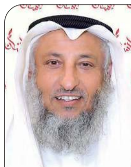
الشيخ د.عثمان الخميس