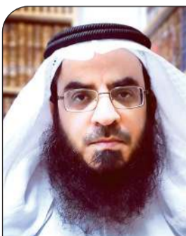
الشيخ سعد الشمري