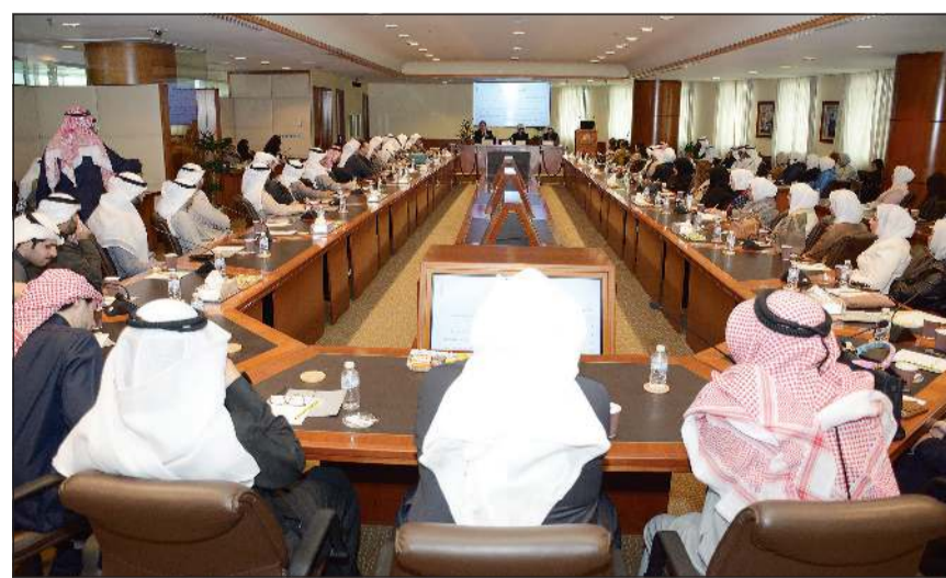
جانب من الحضور خلال ورشة العمل

اختتمت الورشة أعمالها بتوصيات بضرورة تعزيز دور التحكيم وأهمية صياغة اتفاق التحكيم بشكل صحيح صالح وقابل للتنفيذ، يتضمن تحديد الجوانب المهمة دون تفصيل قد يحد من فعالية الاتفاق، وذلك من أجل الحصول على أحكام قابلة للتنفيذ في نهاية المطاف وتجنباً لإطالة أمد العملية التحكيمية مما يفقد التحكيم أهم مميزاته وهي السرعة في حسم النزاع.