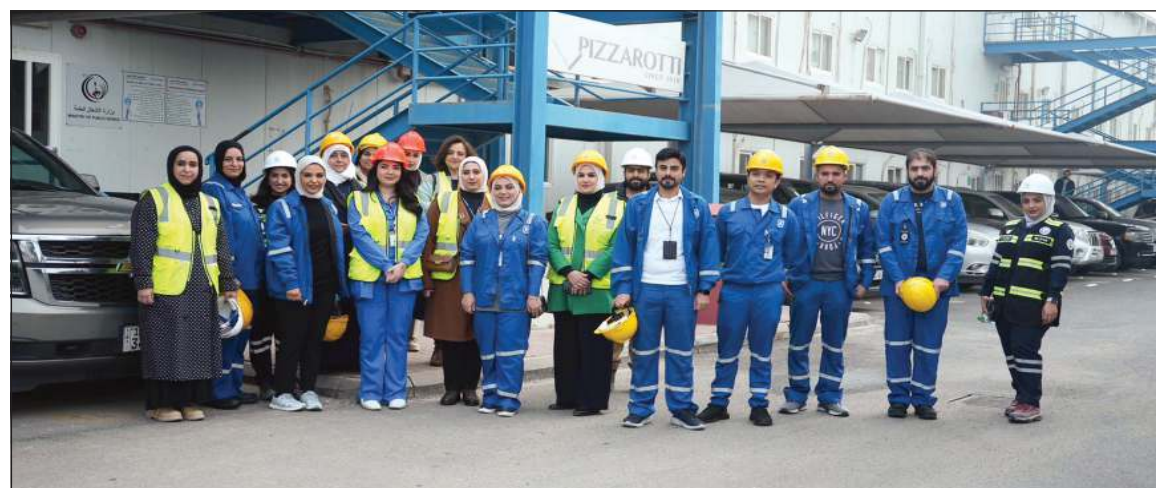
وفد من شركة نفط الكويت خلال زيارتهم لمشروع مستشفى الولادة

ووقف النقل والندب العامة أوقفت النقل والندب داخل القطاع أو خارجياً بين قطاعات الوزارة المختلفة خلال شهري يناير وفبراير، وذلك من خلال تعميم اداري أصدرته وكالة الوزارة م. مي المسعد.