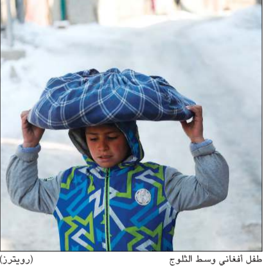
طفل أفغان في وسط الثلوج

كابول - وكالات: أعلنت السلطات في أفغانستان أمس الخميس وفاة أكثر من 160 شخصاً، بسبب البرد هذا الشهر في أسوأ شتاء تشهده البلاد منذ أكثر من عشر سنوات، وسط انخفاض درجات الحرارة كثيراً عن درجة التجمد. وقال المتحدث باسم وزير إدارة الكوارث شفيع الله رحيمي «لقي 162 حتفهم بسبب الطقس البارد منذ العاشر من يناير حتى الآن»، وجرى تسجيل نحو 84 من هذه الوفيات الأسبوع الماضي فقط. ويضرب الشتاء، الأكثر برودة منذ 15 عاماً والذي يشهد انخفاض درجات الحرارة إلى 34 درجة مئوية تحت الصفر، أفغانستان. وأضاف رحيمي أن نحو 70 ألف رأس ماشية، تجمدت أيضاً حتى نفقت، بمختلف أنحاء البلاد.