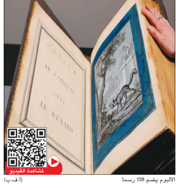
الألوم يضم 138 رسماً (أ.ف.ب)

نيويورك - أ.ف.ب: بيعت نسخة فريدة من الرسوم التوضيحية لكتاب «حكايات لفونتين»، بتوقيع الرسام الفرنسي من القرن الثامن عشر جان باتيست أودري، في نيويورك الأربعاء مقابل 2,7 مليون دولار، في مزاد نظمتها دار كريستيز. هذه القطعة الثمينة لعشاق الكتب عبارة عن اليوم سميك مكون من 138 رسماً مع مناظر طبيعية مفصلة، مؤطر بمخطط أزرق، وكل من هذه الرسوم يوضح إحدى القصص الشهيرة للكاتب والشاعر الفرنسي جان دي لا فونتين، بينها «الزير والنملة» و«الغراب والفعلب». وكان جان باتيست أودري (1686-1755)، رسام البلاط الفرنسي في عهد لويس الخامس عشر، قد أنجز هذه الأعمال في أوائل ثلاثينيات القرن الثامن عشر بالفراشة والحجر الأسود، لكن لم يتم تجميعها على الفور. وأوضح المسؤول الدولي عن الرسوم القديمة لدى دار كريستيز ستين الستين لوكالة فرانس برس، أن المجموعة تضم «جزءاً واحداً بحالته الأصلية لرسوم توضيحية أنجزها أودري لـ (حكايات) لا فونتين»، لافتاً إلى أن الجزء الثاني كان موجوداً ولكن «تم تشتيته» وتوزعه بين المجموعات والمتاحف. ويعد جان باتيست أودري أحد أفضل رسامي حكايات لفونتين، إلى جانب غوستاف دوريه وجان إينياس غرافيل.