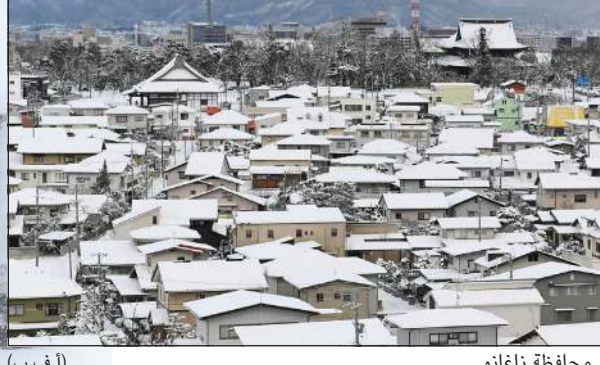
تراكم الثلوج فوق أسطح المنازل في محافظة ناغانو

طوكيو - (د.ب.أ): فيما أودت العواصف الثلجية العاتية والبرد القارس بحياة 5 أشخاص على الأقل في اليابان، أطلقت طوكيو أمس أيضاً بنجاح صاروخاً يحمل قمراً اصطناعياً استخباراتياً لتحسين الاستجابة للكوارث ومراقبة التطورات في المواقع العسكرية بكوريا الشمالية، وسجلت درجات الحرارة مستويات منخفضة قياسية بلغت 12 درجة مئوية تحت الصفر في بعض أجزاء البلاد. وتأثرت حركة القطارات والطرق بشدة، وغطت الثلوج الكثير من الطرق. واقادت وسائل الإعلام المحلية أمس بأن الآلاف من الأشخاص اضطروا إلى قضاء الليلة في مقصورات القطارات أو في المحطات في مقاطعتي كيوتو وشيغا بغرب البلاد، بينما تقطعت السبل بسائقي السيارات في بعض الطرق الرئيسية. وتشهد اليابان حالياً أشد بداية لفصل الشتاء حتى الآن. ووجهت السلطات تحذيراً للسكان في المناطق المطلة على بحر اليابان، وكذلك ساحل الأطلسي بهطول المزيد من الثلوج. وفيما يتعلق بالقمر الاصطناعي، الذي أرجئ إطلاقه يوماً بسبب الطقس السيئ، فإنه يمكن التقاط صور على الأرض في الليل، بالإضافة إلى أوقات الطقس السيئ، كما أنه يمكن استخدامه لنقل البيانات في حال وقوع كارثة طبيعية، وذلك وفقاً لمركز استخبارات الأقمار الاصطناعية التابع لمجلس الوزراء الياباني.