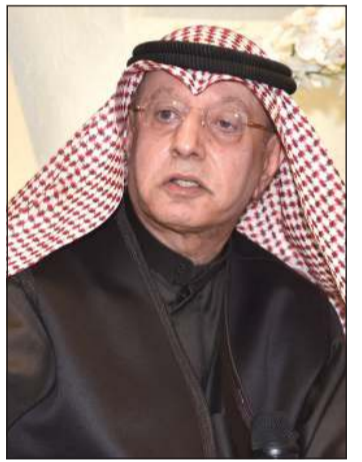
د. بدر مال الله متحدثاً عن أساسيات تحقيق التنمية