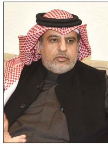
ماضي الخميس متحدثاً عن أنشطة الملتقى الإعلامي