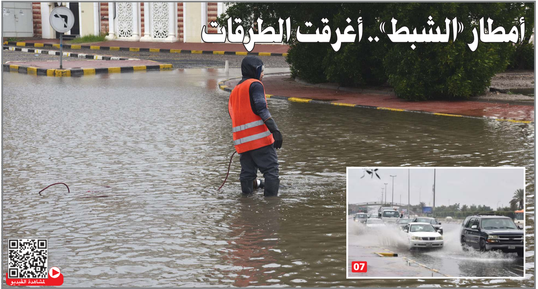
أحد العمال يقوم بسحب المياه.. وفي الإطار آثار الأمطار على الطرق