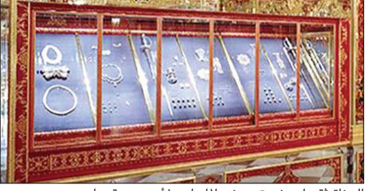
الجنابة تقبوا صندوق عرض المسات بفاس وسرقوها

دريسدن - (د.ب.أ): قدم أحد المتهمين في جريمة السطو على مقتنيات ثمينة من متحف «القبو الأخضر» في مدينة دريسدن الألمانية اعترافات بتورطه في الجريمة. وقال المتهم (29 عاماً) أمام المحكمة في دريسدن أمس الثلاثاء: «لم أكن في دريسدن فقط، بل كنت في غرف القبو الأخضر بنفسى»، موضحاً أن مهمته كانت التسلق عبر نافذة مهينة للاقتحام مع شخص آخر غير منهم في القضية، وتحطيم صندوق العرض في غرفة المجوهرات وسرقة قطع المجوهرات. «لأنه توافق لدي القوة لذلك وكنت مستعداً للتنفيذ». تجدر الإشارة إلى أن الواقعة تمثل واحدة من أكثر السرقات الفنية إثارة للفضيحة في ألمانيا، حيث تمكن اللصوص من اقتحام المتحف صباح يوم 25 نوفمبر 2019، ونقبوا صندوق عرض بفاس وانتزعوا ما مجموعه 4300 ماسة بقيمة تزيد على 113 مليون يورو. كما تسبب الجنابة أيضاً في إحداث تلفيات عينية بقيمة تزيد على مليون يورو.