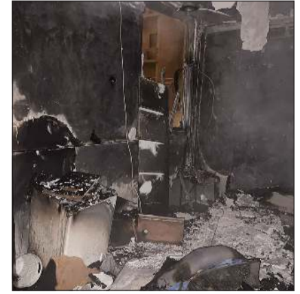
حريق الطابق السادس تسبب في تلفيات بالغة بالشقة