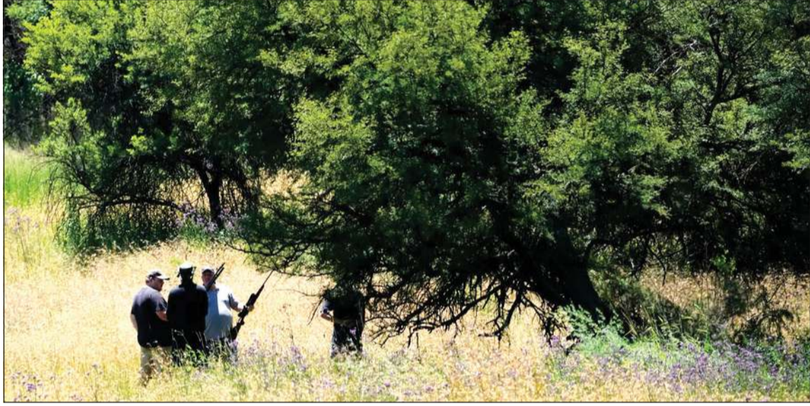
جانب من عمليات بحث الشرطة عن أنثى النمر