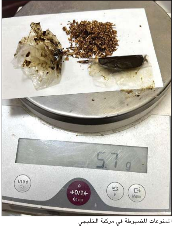
المنوعات المصبوطة في مركبة الخليجي