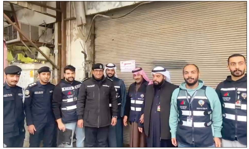
ضباط ومفتشون من وزارة التجارة شاركوا في الحملة