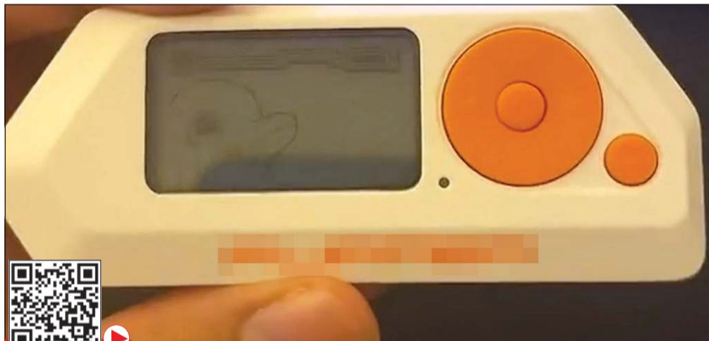
الجهاز المستخدم في سرقة البيانات البنكية عن بعد