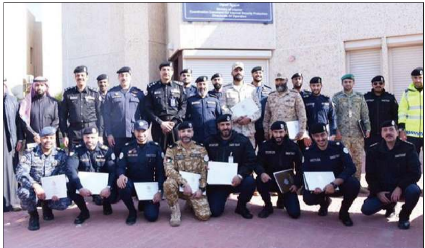
المشاركين في الدورة

أقيمت خلال الفترة من 8 إلى 12 الجاري وذلك بمشاركة 21 ضابطاً من مختلف القطاعات في وزارة الداخلية والجيش الكويتي والحرس الوطني.