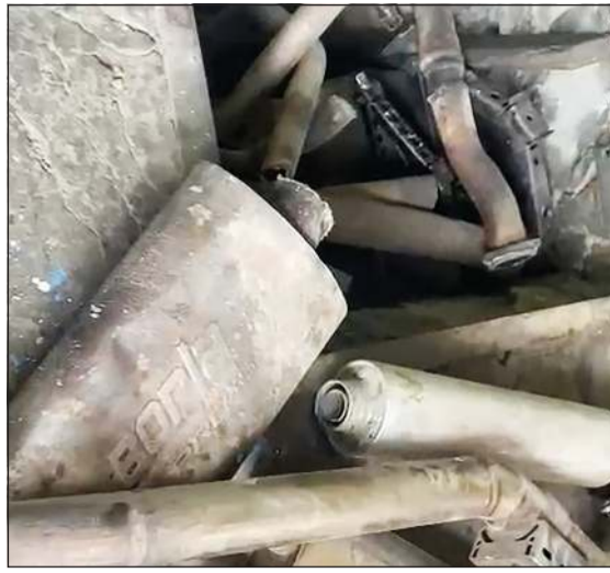
اكزوزات تستغل من قبل عدد من الكراجات

استوقفتني ما ورد على لسان مدير عام الإدارة العامة لمكافحة المخدرات العميد محمد قبايزد في لقائه المتميز مع جريدة «الأبناء» أن ما ضبط خلال بضع سنوات على كل ربوع البلاد للتصدي لأي خروج على القانون مشددة بأنه لا تهاون في ردع الورش والقرارات الوزارية التي تقوم بتركيب عوادم المركبات وتغيير الشكل الجوهري للمركبة ومخالفة شروط الأمن والسلامة.