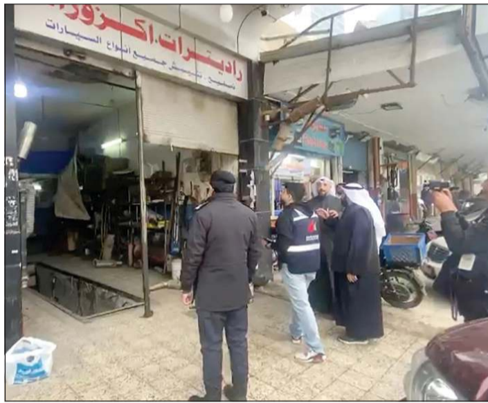
الحملة استهدفت مجموعة من المحلات تقوم بتركيب أدوات تصدر عنها أصوات مزعجة