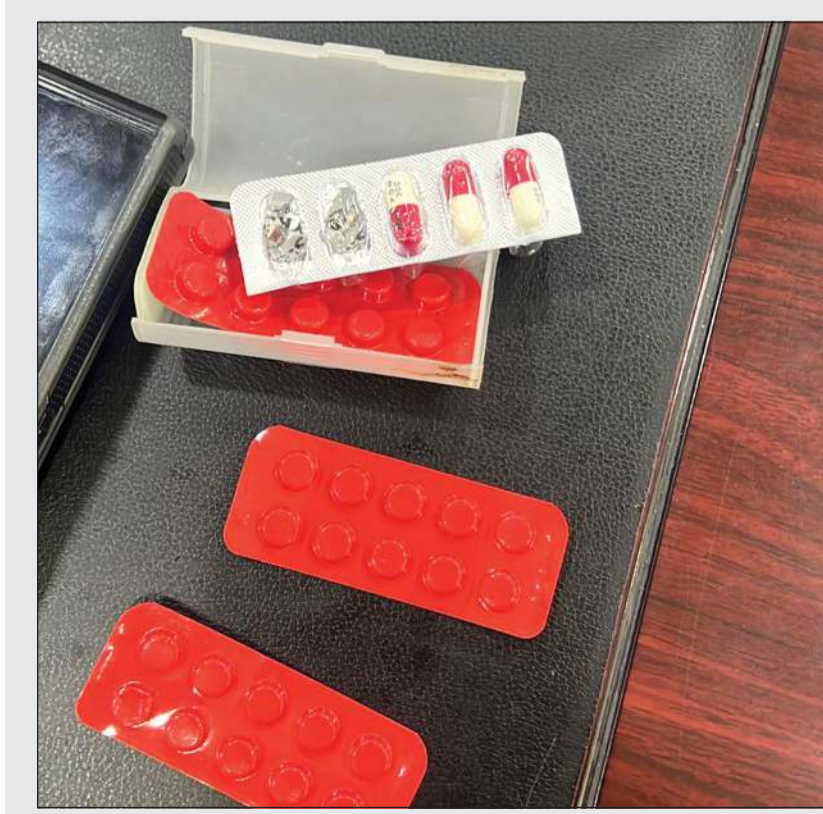
الحبوب التي وجدت داخل حقيبة المواطن