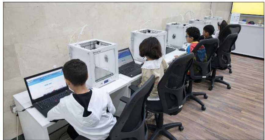
جانبا من الأطفال خلال التدريب

وكيفية إعداد وبناء مشاريع مرتبطة بواقعهم 3D Design والتعرف على احد طرق الرسم الرقمي القائم على تكنولوجيا الطباعة ثلاثية الأبعاد وكيفية عمل التصاميم وتنفيذها من خلال الطابعات، والروبوت سيعلّم المتدرب كيفية تنمية مهاراته في المجالات الميكانيكية الإلكترونية والبرمجية بشكل متكامل لتنمية مهارات التفكير العليا وحل المشكلات، والتعرف على مفهوم الذكاء الاصطناعي في برمجة واستخدام الذكاء الاصطناعي لإنتاج تطبيقات مطورة.