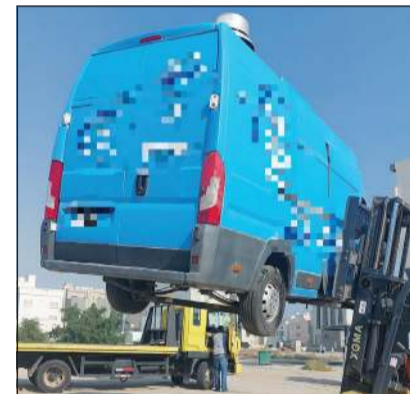
رفع إحدى السيارات المهمة

وضع 74 ملصقا لسيارة وقارب مهملين تمهيدا لإنزالهما بعد انتهاء المدة المحددة. وأشار إلى تواصل الجولات الميدانية من قبل الفريق الرقابي بإدارة النظافة العامة وإشغالات الطرق، مبيناً في هذا الخصوص عدم تهاون الفريق الرقابي في اتخاذ الإجراءات القانونية حيال المخالفين للائحة النظافة العامة وإشغالات الطرق.