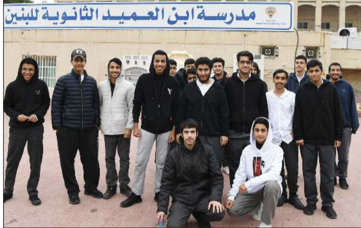
مدرسة ابن العميد الثانوية للبنين