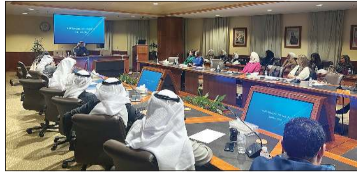
جانب من فعاليات الدورة التدريبية لمركز التحكيم التجاري التابع لـ «الغرفة»

عقد مركز الكويت للتحكيم التجاري على مدار يومي 26 و 27 ديسمبر الجاري، دورة تدريبية بعنوان «صياغة شروط التحكيم في العقود باللغة الإنجليزية»، وذلك بالتعاون مع إدارة الفتوى والتشريع في ختام فعاليات الموسم الثقافي المشترك لعام 2022.