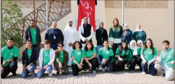
المتطوعون من البنك الأهلي المتحد ولويك في المباركية لتوزيع كسوة الشتاء

نخفف عنهم وطأة موجة البرد التي تشهدها البلاد في فصل الشتاء، فضلاً عن دور هذه المبادرة في تنمية روح المسؤولية المجتمعية لدى موظفي البنك ومنحهم فرصة المشاركة في الأنشطة الموجبة لخدمة المجتمع. وأوضحت: إن هذه المبادرة تأتي انطلاقاً من حرص البنك الدائم على الاهتمام بالفئات غير المقتدرة ومد يد العون والمساعد لهم، وإشعارهم بتقدير ظروفهم، ما يبعث على مد جسور التواصل والترحم والتكافل الاجتماعي بين أفراد المجتمع.