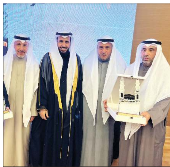
تكريم حملة الضويحي

إحدى قيم إستراتيجية الوزارة فأبنا نتطلع في السنوات المقبلة إلى المزيد من التطوير والإبداع والابتكار، كما أدعو إلى المزيد وتحقيق مكاسب وأعدة تصب في مصلحة تطوير الحملات. وزاد: أتقدم بالشكر الجزيل إلى مقام صاحب السمو الأمير الشيخ نواف الأحمد وسمو ولي العهد الشيخ مشعل الأحمد ورئيس الوزراء سمو الشيخ أحمد نواف الأحمد الصباح على الاهتمام والدعم الوفير والمساندة الكبيرة لبعثة الحج وحجيج الكويت بوجه عام، ونتطلع للحفاظ على المكتسبات التي حققتها بعثة الحج، والشكر موصول إلى حكومة السعودية الشقيقة على جهودها الكبرى، في خدمة حجاج بيت الله الحرام بأساليب متطورة وآليات حديثة، وجهودها في استقبال بعثة حجاج الكويت وتسهيل عمل الحملات الكويتية، وأخص بالذكر سفير المملكة بالكويت وأعضاء السفارة. وفي ختام الحفل قام أصحاب حملات الحج الكويتية.