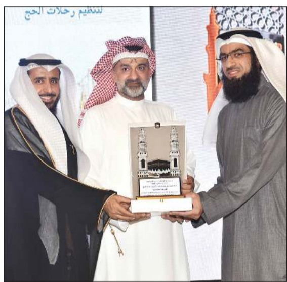
..وحملة شركة منديار

الغالية، ومنذ الرعييل الأول، فضل سابق، ودور رائد في تسيير حملات الحج والاهتمام بها، حيث كانت قوافل الحجيج تسير على الدواب والأقدام قبيل اختراع وسائل النقل الحديثة، مما يدل على ملكة الإبداع في الشخصية الكويتية التي سبقت تفكير عصرها إلى كل جديد والمتطلعة إلى كل شأن من شأنها، وانطلاقاً من مبدأ الإبداع الذي يمثل