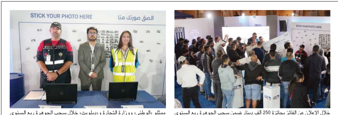
خلال الإعلان عن الفائز بجائزة 250 ألف دينار ضمن سحب الجوهرة ربع السنوي

أعلنت شركة زين عن استراتيجيتها المتعلقة بمكافحة عمالئنا، كما يمثل قناة إخبارية مميزة تشجع العملاء على الإخبار ما يجعله عاملا رئيسيا في تحقيق الهدف من استراتيجية الوطني لتحقيق الشمول المالي وترسيخ ثقافة الإخبار. ووعد العثمان العملاء بتقديم المزيد من التجارب والفعاليات الاستثنائية خلال العام الجديد في ظل الروح التي تسود فريق عمل الوطني من حرص شديد على تلبية تطلعات واحتياجات العملاء واعتبارها أهدافا لا يقبل إلا بتحقيقها والوصول برضا العملاء إلى أقصى مستوى ممكن. ويدخل عملاء حساب الجوهرة تلقائيا في السحب على جوائز بقيمة 5 آلاف دينار أسبوعيا و125 ألف دينار شهريا والجائزة الكبرى بقيمة 250 ألف دينار ربع سنوي، حيث إن كل 50 دينارا يقوم العميل بإدائها في حساب الجوهرة تمنحه فرصة ليكون الفائز التالي. ويمكن فتح حساب الجوهرة بكل سهولة من خلال خدمة الوطني عبر الإنترنت وخدمة الوطني عبر الجوال أو من خلال زيارة أقرب فروع بنك الكويت الوطني.