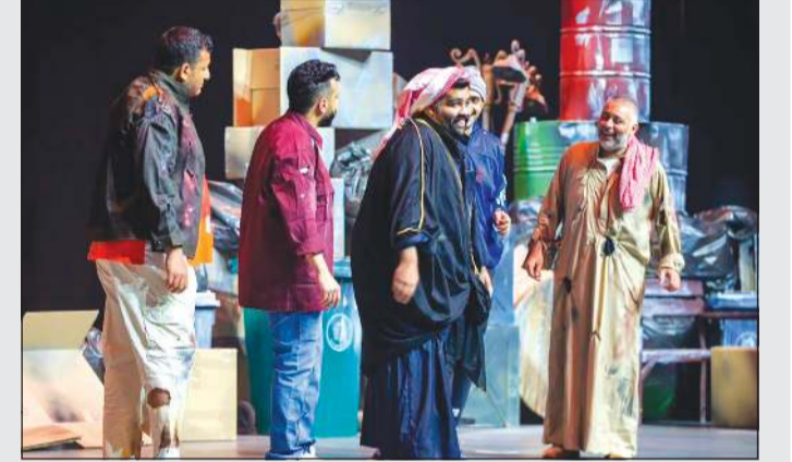
النصار في مشهد من مسرحية «الحرب العالمية السادسة»