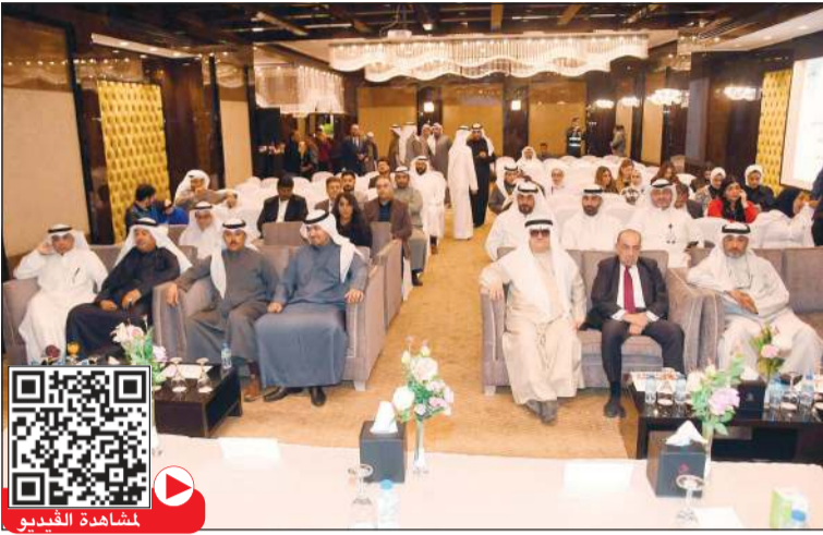
جانب من الحضور خلال توقيع اتفاقية إطلاق مشروع المنصة الإلكترونية «اكتشف الكويت» (محمد هاشم)

وتم في ختام الحفل توقيع اتفاقية التعاون المشترك بين الجمعية الكويتية للمهرجانات واتحاد مكاتب السفر والسياحة الكويتية بشأن مشروع المنصة الإلكترونية للفعاليات والمهرجانات والأنشطة المختلفة وذلك لتنشيط السياحة الكويتية.