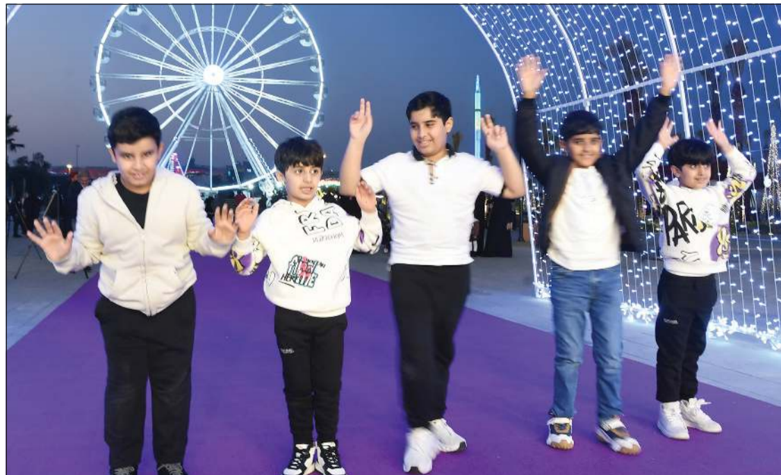
فرحة الأطفال بالمدينة الترفيهية