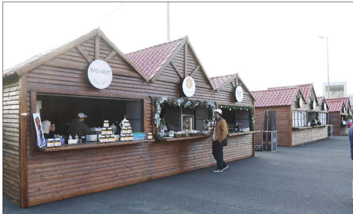
«ونتر وندرلاند» تضم عدداً من المطاعم الكويتية

بعد انتظار طويل لعشاق الألعاب الترفيهية، تم افتتاح مدينة الألعاب الأضخم في الكويت والتي تضم ألعاباً خاصة بفصل الشتاء وذلك في منطقة الشعب، والتي توفر عشرات الألعاب الترفيهية، بالإضافة لوجود مجموعة مميزة من أهم المطاعم العالمية، والتي ستقدم مأكولات ومشروبات متنوعة. ويعد مشروع «ونتر وندرلاند» أحد مشاريع الترفيه الذي يقدم تجربة فريدة من نوعها مع العديد من جولات المغامرات، والمستوحاة فكرة إقامته من منشآت العاصمة البريطانية لندن التي كان الأولى في إطلاق مثل هذا النوع من الفعاليات، حيث يتم توفير عدد كبير من الأنشطة الشتوية المميزة، كالنزل على الجليد، والاستمتاع بتجربة الدخول إلى أعمال الجار من خلال الدخول لمملكة الجليد السحرية، وغيرها الكثير من الأنشطة الترفيهية التي يمكن أن تعزز نوعية الحياة للمواطنين والمقيمين على أراضي