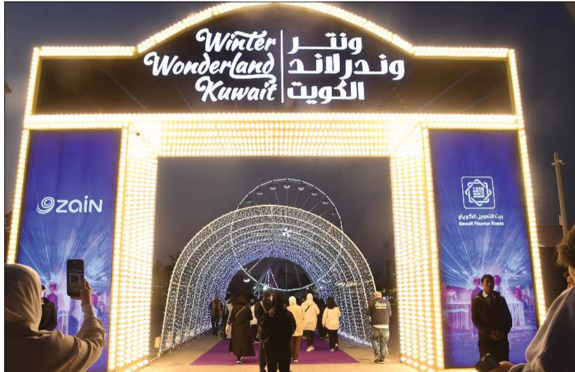
«ونتر وندرلاند» الكويت تضم عشرات الألعاب الترفيهية

ترسم البسمة على وجوه الصغار والكبار بعشرات الألعاب الترفيهية ومجموعة مميزة من أهم المطاعم العالمية