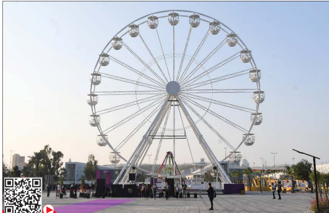
لعبة تحاكي «عين لندن» كما في العاصمة البريطانية