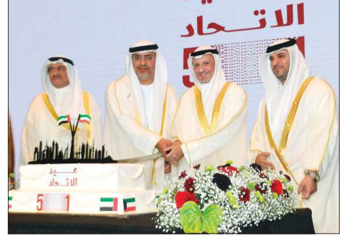
الشيخ سالم عبدالله مشاركا السفير الإماراتي دمطر النياي قطع كعكة الاحتفال

حيث لدينا جالية إيرانية كبيرة تعمل في الإمارات، كما أن ثمة تواصل مستمرا بين البلدين»، مضيفاً: «هناك نوع من التطور في كل دول مجلس التعاون وخصوصاً في الإمارات وذلك بفضل سياسة قيادتهم الحكيمة التي تعمل لمصلحة الدولة، كما أن علاقاتهم مع دول الجوار ممتازة».