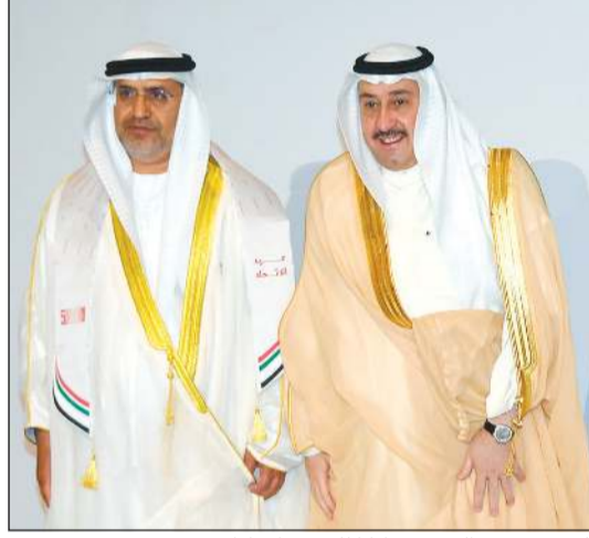
الشيخ فيصل الحمود مباركا للسفير الإماراتي