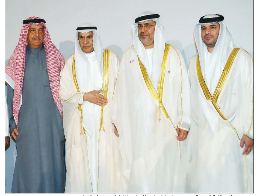
رئيس مجلس الأمة أحمد السعدون مقدا التهاني للسفير الإماراتي دمطر النياي