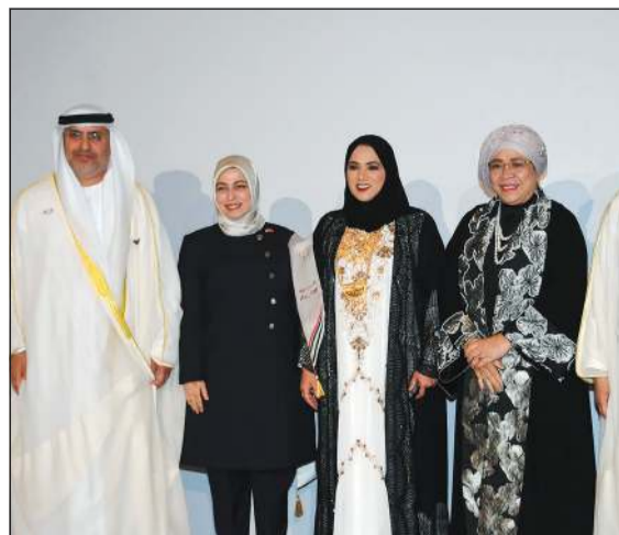
تهنئة من سفيرة تركيا طوي سونمز وسفيرة إندونيسيا ليلى ماريانا