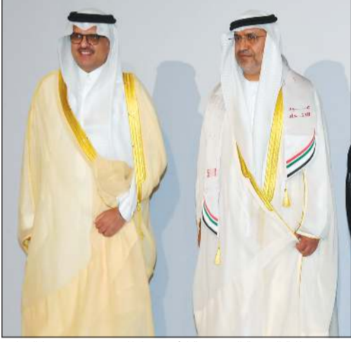
سفير المملكة العربية السعودية الأمير سلطان بن سعد مقدا التهاني