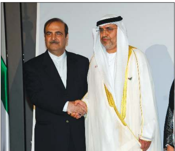
تهنئة من السفير الإيراني محمد إيراني

العمانية، كما أن هناك اهتماماً كبيراً وغير مسبوق للإنسان الإماراتي، إضافة لما تحققة من دور مهم وبارز على المستوى الخليجي، ونذكر تماماً الدور الإماراتي الداعم لمسيرة مجلس التعاون الخليجي وحرصها على تحقيق الإنجازات والمكاسب لهذه المسيرة، كما نذكر أيضاً دعم الإمارات للعمل العربي المشترك، ونؤكد أن هذا الدور سيتواصل بفضل هنا نائب وزير الخارجية الأسبق خالد الجار الله دولة الإمارات العربية قيادة وشعباً بمناسبة اليوم الوطني والذكرى الـ 51 لاتحاد. وقال في تصريح للصحافيين على هامش الحفل: لقد حققت الإمارات إنجازات كبيرة في كافة المجالات على المستوى المحلي والخليجي والعربي والدولي. وعلى الصعيد المحلي، حققت قفزات في الحركة