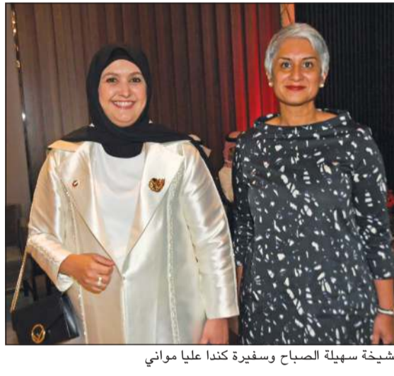
الشيخة سهيلة الصباح وسفيرة كندا عليا مواني