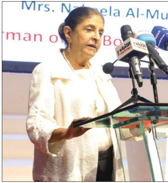
السفيرة نبيلة عبدالله الملا