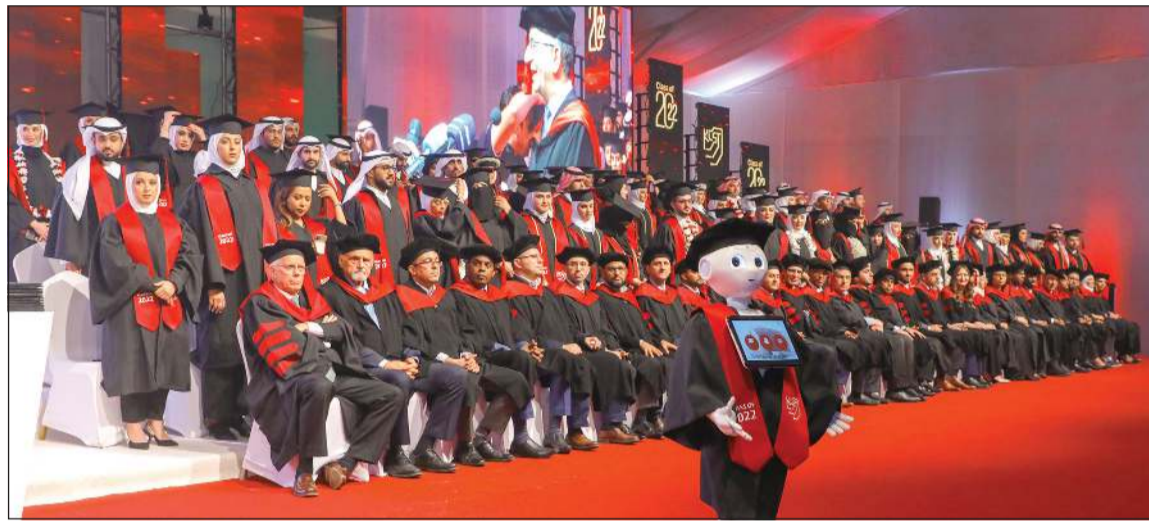
جانب من الاحتفال بالخريجين