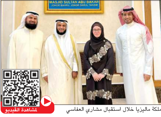
ملكة ماليزيا خلال استقبال مشاري العفاسي

استقبلت الملكة عريزة أمينة ميمونة إسكندرية ملكة ماليزيا في القصر الملكي إستنا نجارا، الشيخ مشاري راشد العفاسي، وأقامت مأدبة غداء تكريماً له والوفد المرافق له. حضر اللقاء ملكة سلنجر السلطانة نور العاشقين بنت عبدالرحمن وعدد من أصحاب السمو الأمراء والأميرات وعدد من المسؤولين. وتأتي زيارة الشيخ مشاري العفاسي إلى ماليزيا ضمن زيارة رسمية لمدة 7 أيام يقوم فيها بافتتاح أكاديمية العفاسي للقرآن الكريم. وتعد هذه الزيارة الثالثة للماليزيا، حيث يحظى بمحبة كبيرة، وقد تزامن المصلون للحضور والصلاة خلفه. وأقام حلقات تصحيح تلاوة القرآن الكريم لغير الناطقين بالعربية.