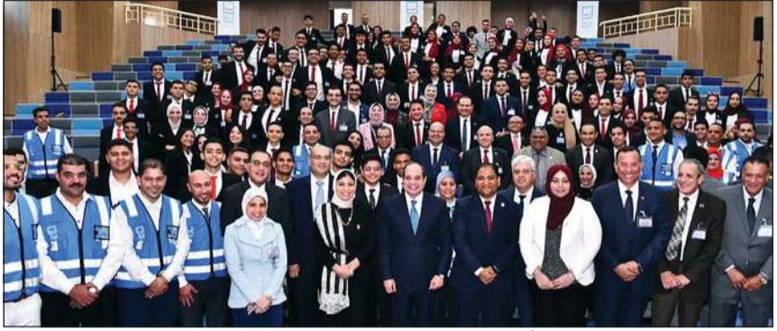
الرئيس عبدالفتاح السيسي متوسطاً العاملين بجامعة المنصورة الجديدة

وقال الرئيس السيسي، في مداخلة خلال كلمة وزير الإسكان والمرافق والمجمعات العمرانية د.عاصم الجزار خلال افتتاح المرحلة الأولى من مدينة المنصورة الجديدة، أمس إن الدولة المصرية تمتلك الكثير من الخبراء والعلماء، وهذا ليس فقط وليد الحالة الراهنة بل هو مشتم منذ فترات زمنية سابقة وإن الدولة تفكر منذ زمن في حل المشكلات والتحديات التي تواجهها في مجال المياه، مشيراً إلى إنشاء الدولة للعديد من محطات تحلية مياه البحر