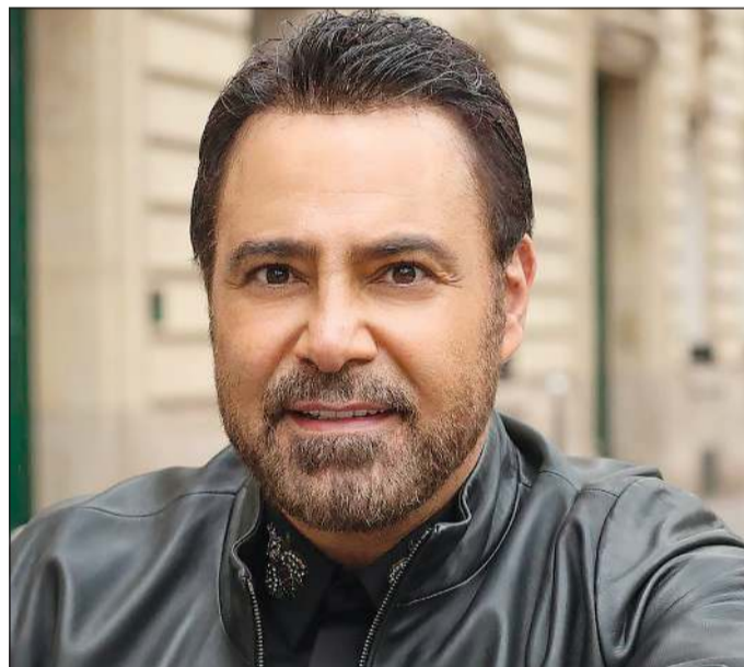
عاصي الحلاني - المنتخبات العربية