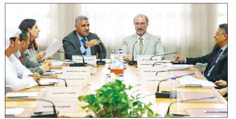
البدري مترشحاً لاجتماع جائزة التميز الإعلامي بحضور ممثلين من تسع دول