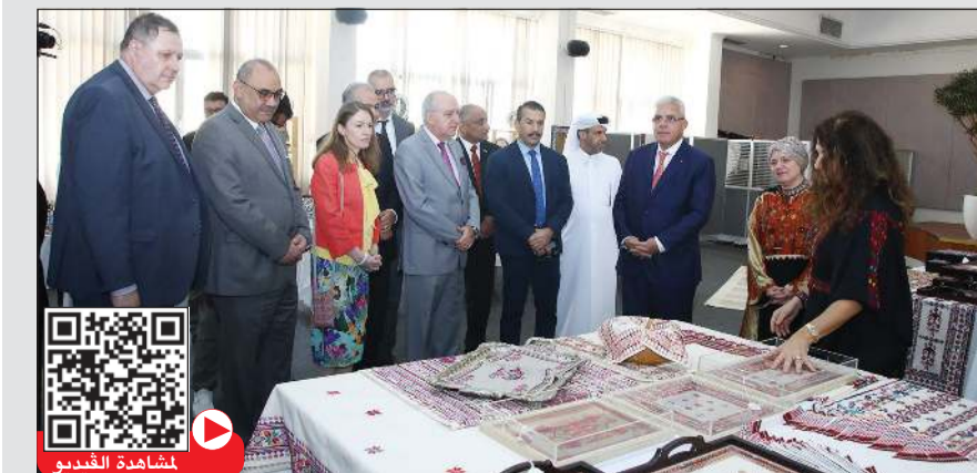
السفير الفلسطيني رامي طهوب وعدد من السفراء خلال جولة بالمعرض

شاركت زميلاتهن الفلسطينيات في إقامة وتنظيم وإحياء هذا المعرض. وأشاد بالتعاون والتبادل الثقافي بين الدولتين وخصوصاً مع المجلس الوطني للثقافة والفنون والآداب الذي يستقبل منذ إعادة افتتاح السفارة الفلسطينية عام 2013 في الكويت جميع الأفكار والمبادرات الثقافية من قبل السفارة، مشيراً في هذا الصدد إلى اختيار الكويت ضيف شرف في أولى مشاركاتها ضمن معرض فلسطين للكتاب عام 2016 والذي حظي باهتمام بالغ من دور النشر والمثقفين الكويتيين.