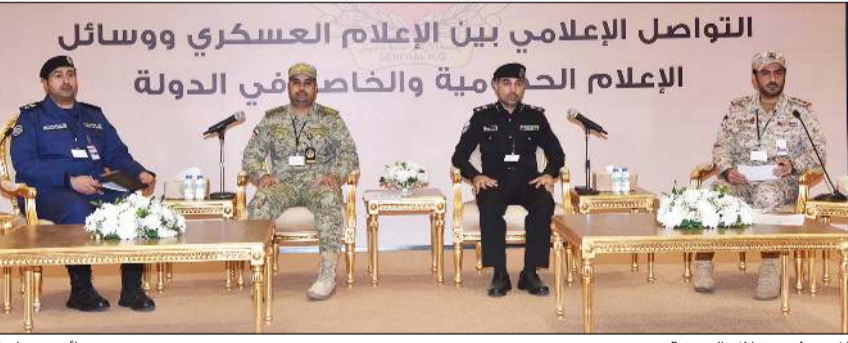
المحذون خلال الورشة

بأنه في سياق متصل، عبر المقدم راشد الهلفي من قوة الإطفاء العام عن شكره