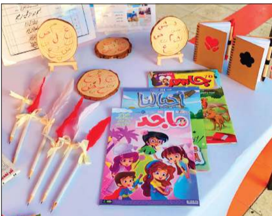
من محتويات المعرض المدرسي في مدرسة عبدالله العصفور

ضمن جولاته التفقدية المفاجئة، قام وزير التربية والتعليم العالي والبحث العلمي د.حمد العدواني بصباح أمس بزيارة تفقدية مفاجئة إلى مدرسة عبدالله العصفور الابتدائية بنين في الظهر، حيث اطلع على وضع المدرسة وآلية سير العمل فيها.