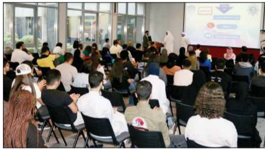
جانب من الحضور خلال ندوة «قل لا للمخدرات»