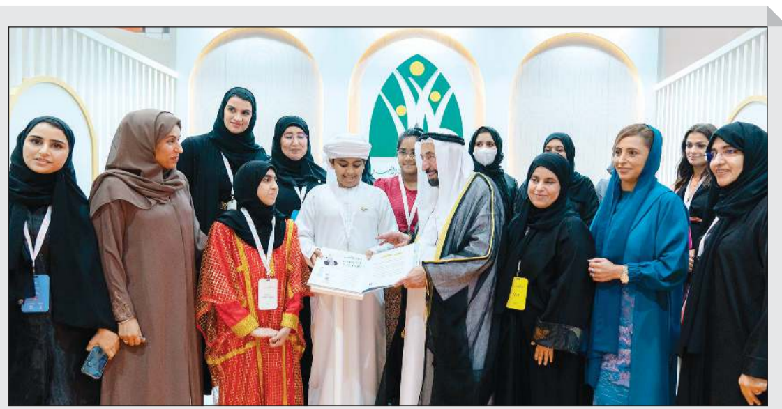
جانب من جولة سمو الشيخ د.سلطان القاسمي في المعرض

بمناسبة احتفال الكويت بالأعياد الوطنية في شهر فبراير من كل عام، وبغية مشاركة جائزة الملتقى للقصة القصيرة العربية بهذه الاحتفالات، ناقش مجلس أمناء الجائزة إمكانية تغيير مواعيد برنامج الاحتفالية الثقافي والإعلان عن الفائز لصباح في شهر فبراير. وكانت لأحة الجائزة، منذ انطلاقها عام 2015، قد حددت مواعيدها على النحو الآتي: الإعلان عن فتح باب الترشيح للجائزة في الأول من يناير حتى 31 مارس من كل عام. إعلان القائمة الطويلة بتاريخ الأول من أكتوبر كل عام. إعلان القائمة القصيرة بتاريخ الأول من نوفمبر كل عام. إقامة احتفالية الجائزة والإعلان عن الفائز في