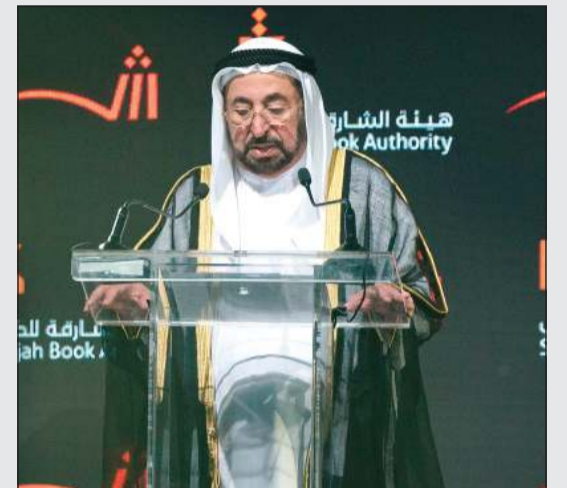
حاكم الشارقة سمو الشيخ د.سلطان القاسمي يلقي كلمة الافتتاح

في هذه المناسبة العظيمة أتوجه بالتهنئة إلى كل أبناء العربية على هذا الإنجاز الذي كنا ننتظره منذ أمد بعيد، وسعادتنا كبيرة بهذه الأجزاء الـ 36 التي تُورخ لـ 9 أحرف من حروف العربية، ونحن اليوم في منتصف الطريق والمستقبل القريب حافل بالخيرات بإذن الله. وتناول أهمية وفوائد المعجم في البحث والتاريخ، وشموليته لكل المعارف اللغوية العربية وتفرده المعلوماتي قائلاً: إن المعجم التاريخي الذي ما أنجز منه متاحا بشكله المطبوع والرقمي ليس معجماً كسائر المعاجم يشرح معاني كلمات العربية ويعرف بمعانيها فقط، وإنما هو سجل هذه الأمة وتاريخها وديوان أشعارها وأخبارها وأمثالها ابتداء من عصر النقوش القديمة ومروراً بجميع أعصر العرب التاريخية ووصولاً إلى العصر الحديث. وقدم القاسمي الشكر إلى كل من عمل وساعد في إنجاز المعجم التاريخي من العلماء الأجداء، قائلاً: يا علماء البروفيسور يوسف فضل حسن.