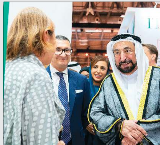
سمو الشيخ د.سلطان القاسمي يتحدثاً للمشاركين