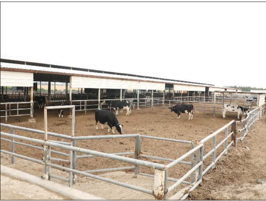
دعم الجهود الرامية إلى تعزيز الأمن الغذائي

وخلال اللقاء طالب عدد من المنتجين بزيادة الدعم للأعلاف ومراجعة الأسعار، ووضع خطة للأمراض الحيوانية والسيطرة على الأوبئة، وقد تساءل أحدهم عن سبب دفع 10 دنانير للتبليغ عن الأمراض، كما طالبوا بدعم البرسيم فالأبقار تحتاج إلى بروتين عال.