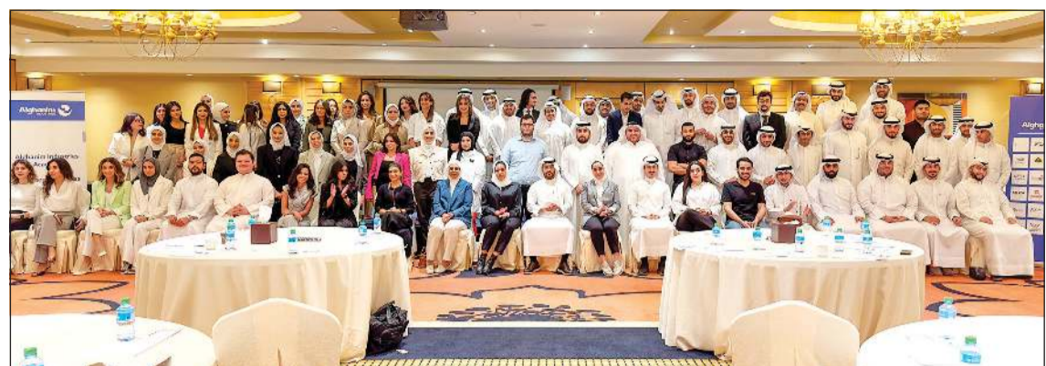
صورة جماعية للدفعة الجديدة من المنضمين لبرنامج «أكاديمية صناعات الغانم»

■ «أكاديمية صناعات الغانم» برنامج تدريبي متكامل لتوظيف وتطوير القوى العاملة الكويتية ■ تخصصات تشمل تكنولوجيا المعلومات والهندسة والتسويق والشؤون المالية والموارد البشرية