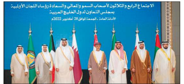
رؤساء اللجان الأولمبية الخليجية في اجتماعهم بالرياض

خمس دورات رياضية خليجية حرصا على استمرار إقامة هذه الدورات والالتزام بمواعيد وأماكن استضافتها. وترأس الشيخ فهد الناصر وفد الكويت، وعقد الاجتماع برئاسة وزير الرياضة رئيس اللجنة الأولمبية العربية السعودية الأمير عبدالعزيز بن تركي الفيصل وبمشاركة الأمين العام لمجلس التعاون د.نايف الجحرف. وبين الأمين العام للجنة الأولمبية الكويتية حسين المسلم أن الاجتماع وضع خارطة الطريق لبرنامج الأحداث الرياضية خاصة الجمعية سواء للشباب أو للكبار أو للصالات أو للفتيات إلى عام 2027. وبين أن هذه الأحداث توزعت على جميع الدول الخليجية، مؤكداً أن دول مجلس التعاون رياضياً، لأن المنافسة الخليجية هي ما ستوصلنا للمنافسة على المستوى الدولي. وتم تأكيد إقامة دورة الألعاب الرياضية الخليجية الأولى للناشئين والشباب 2023 بالإمارات ودورة الألعاب الخليجية الأولى للألعاب القتالية والصالات 2024 بالسعودية، ودورة الألعاب الخليجية الشاطئية الثالثة 2025 بسلطنة عمان، ودورة الألعاب الرياضية الرابعة 2026 بقطر، ودورة الألعاب الخليجية الشاطئية الرابعة 2029 بالبحرين.