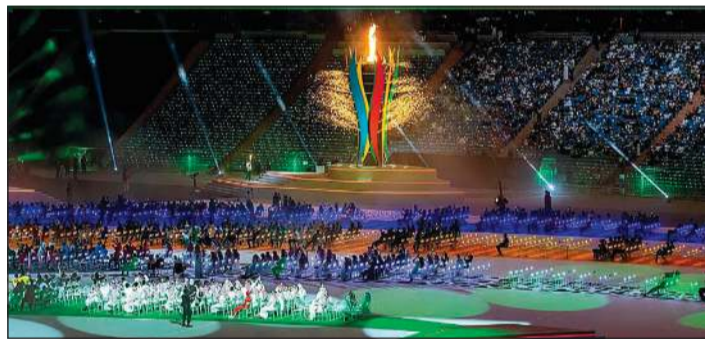
جانب من حفل الافتتاح على استاد الملك فهد الدولي بالرياض