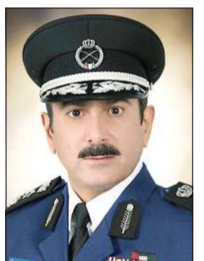
الفريق خالد المكرم

الدفاع الوطني (490) لرتبة قائد ووسام الدفاع الوطني (427) لرتبة فارس ووسام الواجب العسكري (223) من الدرجة الأولى ووسام الواجب العسكري من الدرجة الثانية لعدد (51) ووسام الخالصة لـ (71) ونوط الخدمة الذهبي لعدد (164) ونوط الخدمة الفضي لـ (175) ونوط الخدمة البرونزي لـ (94). وعاهد الفريق الخالد المكرم