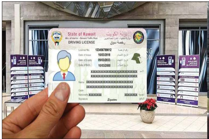
رخص السوق يجب التأكد من صلاحيتها عبر تطبيق هويتي

الوافدون مطالبون بالعودة إلى «هويتي» و«الإبعاد» ينتظر من يقود مركبة برخصة «مسحوبة» في التطبيق