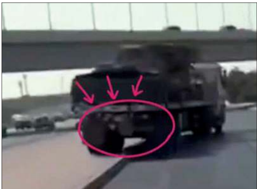
الشاحنة وقد وفق نشاطها لتجاوزها لقانون المرور