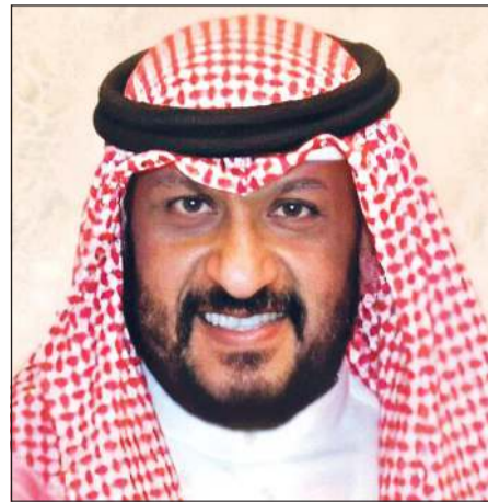
الشيخ طلال الخالد