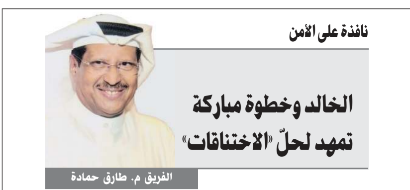
نافذة على الأمن

إلى ذلك، قال مصدر أمني لـ«الأناباء» أن من ينطبق عليهم تعليمات وزير الداخلية جميع من صدرت لهم رخص سوق ما بعد القانون المنظم لحصول الوافدين على رخص سوق والصادر في الأول من شهر أبريل من العام 2013، وتقدر «اللياسن» المقرر التدقيق عليها بعشرات الآلاف. وأضاف المصدر بموجب القانون الصادر والمنظم لحصول الوافدين وضعت وزارة الداخلية ضوابط منها المؤهل الجامعي وشروط الراتب وحيازة الوافد على الكويت من كل مكروه.