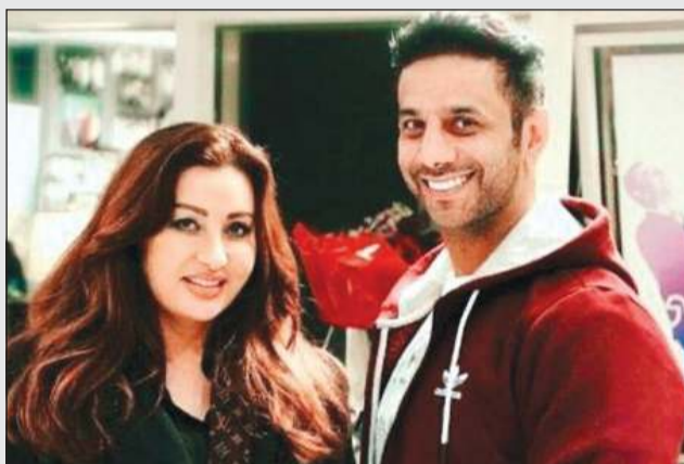
.. ومع لطيفة التونسية