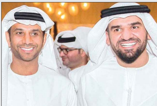
فايز السعيد مع حسين الجسمي