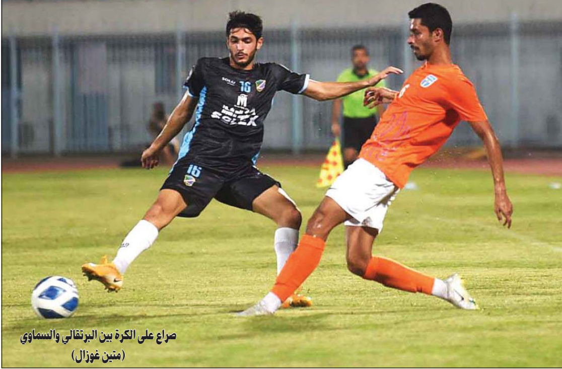
صراع على الكرة بين البرتقالي والسماوي (منين غوزال)