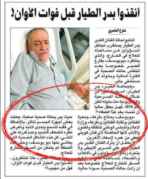
ما نشرته «الأنباء» في عددها الصادر يوم الأحد 2 أكتوبر 2022