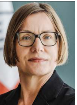
ميريانا سولوياريش إيفر

الكويت تتابع بقلق تطورات الأزمة الروسية - الأوكرانية