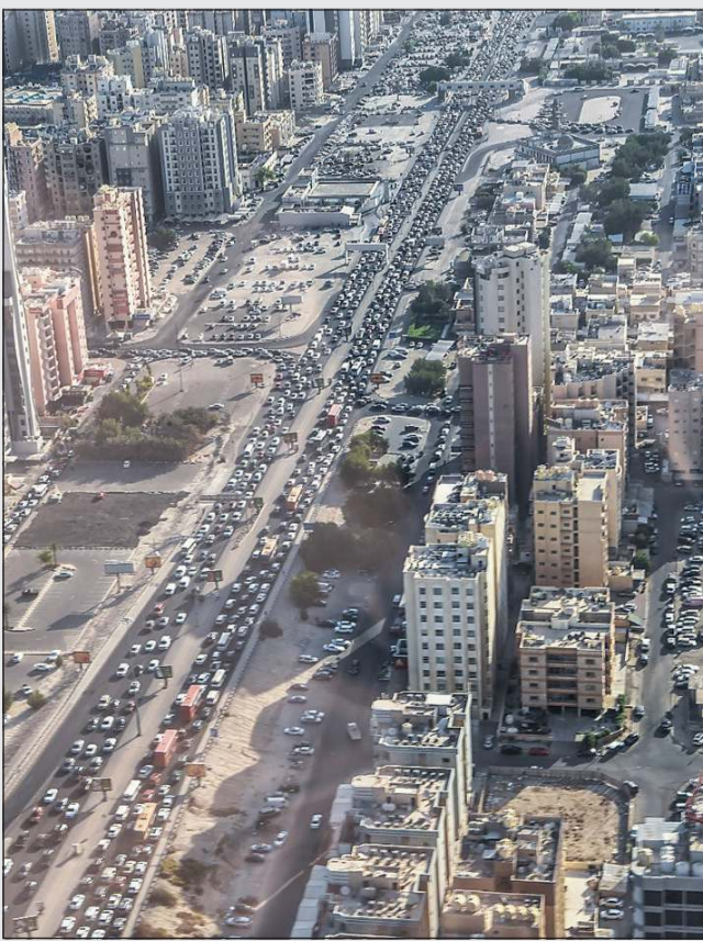
لقطة من الجو تظهر الازدحام في أحد الطرق الرئيسية