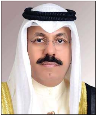
سمو الشيخ أحمد نواف الأحمد الصباح

بعث سمو الشيخ أحمد نواف الأحمد الصباح رئيس مجلس الوزراء ببرقية تعزية إلى الرئيس جوزيف آر بايدن رئيس الولايات المتحدة الأميركية الصديقة، ضمنها سموه خالص تعازيه وصادق مواساته بضحايا إعصار (إيان) الذي ضرب جنوب شرقي الولايات المتحدة الأميركية الصديقة، كما بعث سمو الشيخ أحمد نواف الأحمد الصباح رئيس مجلس الوزراء ببرقية تهنئة إلى الرئيس د. فرانك فالتر شتاينماير رئيس جمهورية ألمانيا الاتحادية الصديقة بمناسبة العيد الوطني لبلاده.