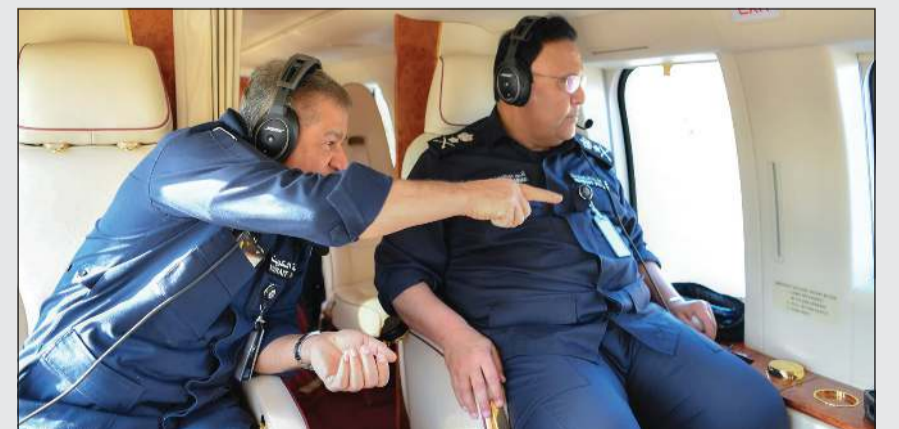
الفريق أنور البرجس يتابع الطرقات ويستمع من اللواء جمال الصايغ إلى جهود تحقيق انسيابية في الطرقات

كشف مصدر أمني عن أن قطاع المراقبة في المرور فعل تجريب المخالفات المرورية عن طريق كاميرات السرعة التي ترصد أي قائد مركبة لا يتقيد بارتداء حزام الأمان والتحدث بالهاتف النقال خلال القيادة. وقال المصدر إن كاميرات المراقبة تقوم برصد السرعة وعدم ارتداء حزام الأمان واستخدام الهاتف بتعليمات من مدير المرور اللواء يوسف الخدة وتجمع المخالفة بين المخالفات الثلاث في وقت واحد.