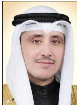
الشيخ د. أحمد ناصر الحمد

التطورات الحالية في الأزمة الروسية - الأوكرانية المتعلقة بإعلان روسيا ضم أراض أوكرانية وتشدد على ضرورة احترام سيادة أوكرانيا وسلامة أراضيها ضمن حدودها المعترف بها دولياً. وجددت وزارة الخارجية في بيان لها امس موقف الكويت الداعي إلى ضرورة الالتزام بميثاق الأمم المتحدة والمبادئ الراسخة في القانون الدولي المنظمة للعلاقات بين الدول بما فيها تلك الواردة بالميثاق المتعلقة بفض المنازعات الدولية باستخدام الوسائل السلمية وانتهاج مبدأ الحوار.