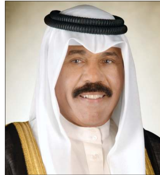
صاحب السمو الأمير الشيخ نواف الأحمد

العيد الوطني لبلاده، متمنيا سموه له موفور الصحة والعافية ولجمهورية ألمانيا الاتحادية وشعبها الصديق كل التقدم والازدهار.