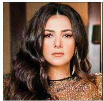
دنيا سمير غانم