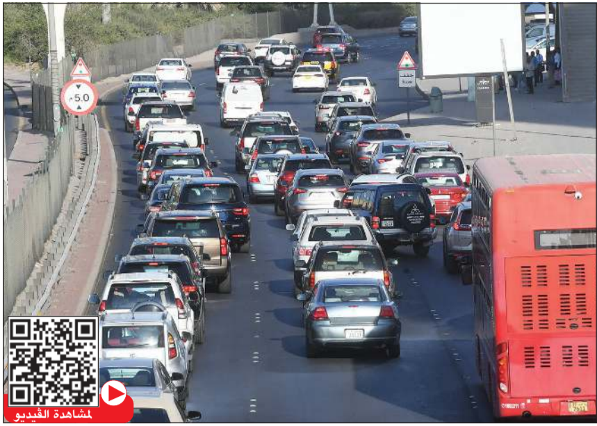
الطرق الرئيسية.. الازحام سيد الموقف (محمد هاشم)