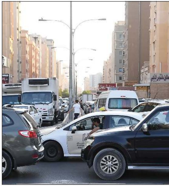
بعض الشوارع شهدت اختناقات منذ الصباح