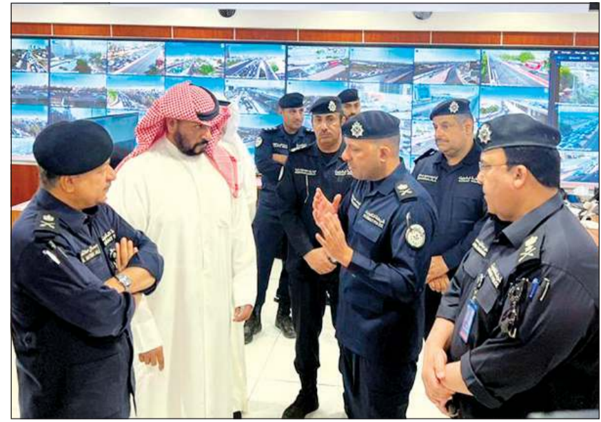
الشيخ طلال الخالد وبحضور الفريق أنور البرجس يستمع من اللواء يوسف الخدة إلى خطة تسهيل حركة السير