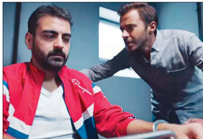
عبدالله الطراوة وعبدالله عبدالرضا في المسلسل