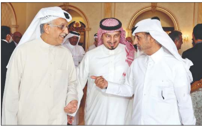
الشيخ سلمان بن إبراهيم والشيخ حمد بن خليفة بن أحمد وياسر المسحل

الجمعية العمومية تزكيت الشيخ سلمان بن إبراهيم آل خليفة رئيسًا للاتحاد القاري لولاية ثالثة بجانب منصب نائب رئيس «فيفا»، حيث حصل على تأييد 46 اتحادًا وطنيًا من جانب آخر، تنطلق اليوم منافسات دورة «دوحة أفنيو» الدولية لكرة السلة، التي تقام في الصالة المغلقة بنادي الغرافة، تحت إشراف الاتحاد القطري لكرة السلة، ومن تنظيم شركة «دوحة أفنيو سبورت»، وذلك ضمن استعدادات الفرق للمشاركة في البطولة العربية للأندية التي ستقام في الكويت الشهر المقبل.