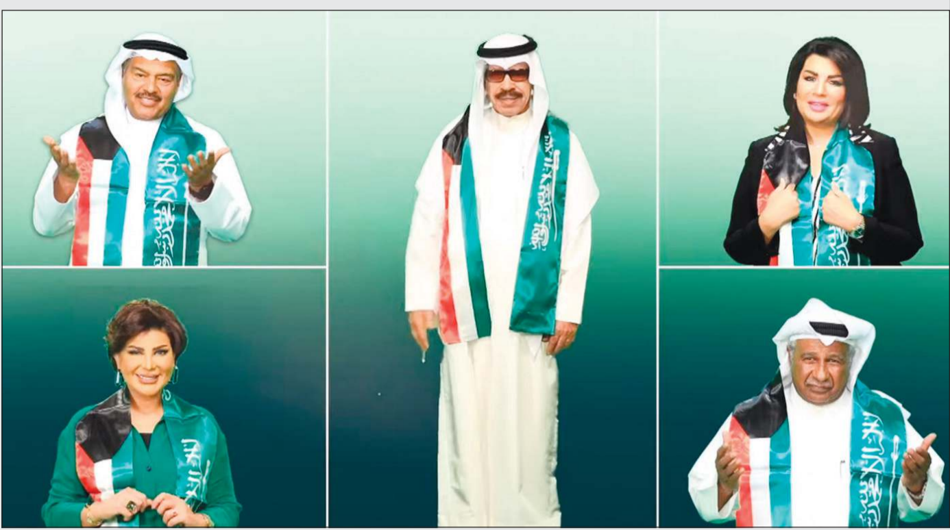
عبدالرحمن العقل مع نجوم الكويت في الفن والإعلام والرياضة شاركوا المملكة العربية السعودية فرحة اليوم الوطني الـ 92

بمناسبة اليوم الوطني الـ 92 من غناء عبدالله الرويشد وإخراج سامي الراشد