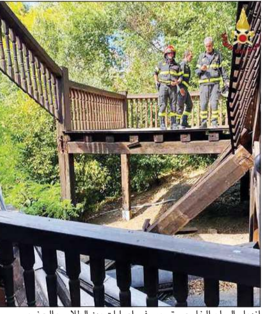
انهيار السلم الخارجي تسبب في إصابات بين الطلاب والحضور

روما - د.ب.أ.: أصيب عدد من الطلاب عندما انهيار سلم خارجي بمسرح جلوب في حدائق فيلا بورجيزي في روما أمس. ووفقا لوكالتي أنباء «انسبا» و«انكرونوس»، انهيار جزء من السقالات الخشبية للمسرح المقام في الحديقة الشهيرة لدى نهاية أحد العروض التي قدمها الطلاب، وأسفر ذلك عن إصابة خمسة من المراقبين ومثلهم من البالغين ونقلوا جميعا إلى المستشفى. وقال رئيس البلدية روبرتو جوالتييري أثناء زيارته لموقع الحادث، إنه يبدو أن السلم تحرز من دعائم التأمين الخاصة به «وإنه لحادث مروع». وقال أحد المعلمين لصحيفة «لا ريبوبليكا»: «خرجنا بعد العرض ثم انهيار السلم... لقد سقط الطلاب بين الألواح، على عمق 3 أمتار، من الطابق الثالث إلى الثاني».