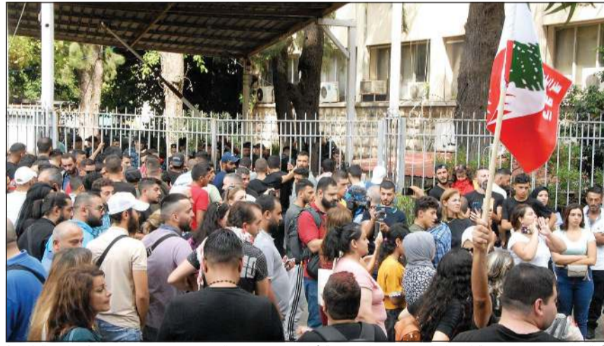
أهالي الموقنين في قضية اقتحام المصارف خلال وقفة أمام قصر العدل (محمود الطويل)

تزايد المؤشرات على احتمال تشكيل حكومة جديدة قبل نهاية ولاية رئيس الجمهورية ميشال عون، أو استمرار الحكومة الحالية بعد تعديلها، باستبدال وزير المهجرين عصام شرف الدين، الذي تصرف في وزارته بتفرد أساء لعلاقته برئيس الحكومة، ووزير المال يوسف الخليل الذي شعر بأنه بغرد خارج السرب فكان خيار مرجعه السياسي، رئيس مجلس النواب نبيه بري، استبداله بالنائب السابق ياسين جابر.