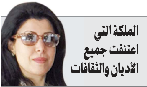
الشيخة حصة الحمد السالم الصباح