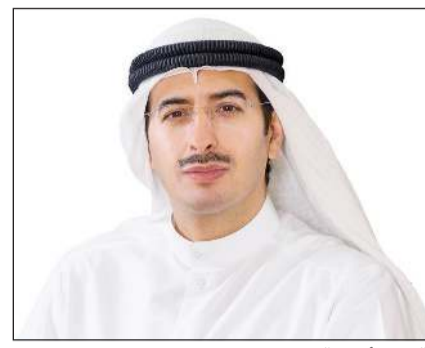
الشيخ أحمد الدعيج

الربع الثاني من عام 2022، الجدير بالذكر أن إجمالي عدد العمالة الوطنية في القطاع المصرفي قد ارتفع من 1543 عاملاً بنهاية عام 2000 ليصل إلى 10,552 عاملاً بنهاية الربع الثاني من عام 2022، وبمعدل نمو سنوي متوسط بلغ 9.4٪ بنهاية عام 2021. وقد ارتفع إجمالي عدد العمالة الوطنية العاملة في البنوك الكويتية من 1543 عاملاً في عام 2000 إلى 10,243 عاملاً بنهاية الربع الثاني من