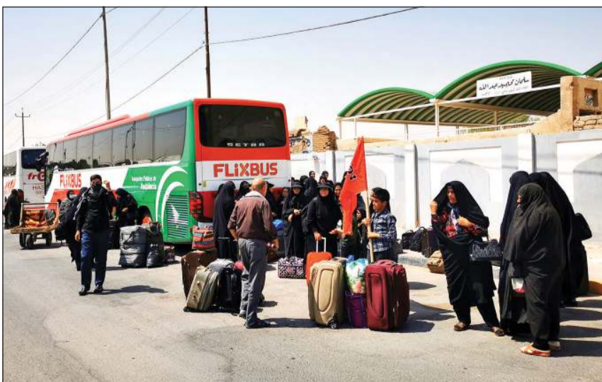
زوار إيرانيون يستعدون لمغادرة النجف بعد المواجهات الدامية في بغداد