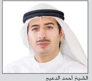
الشيخ أحمد الدبيج

35.9 مليار دينار القيمة السوقية لـ 27 شركة بالسوق الأول.. تستحوذ على 78٪ من قيمة «البورصة»