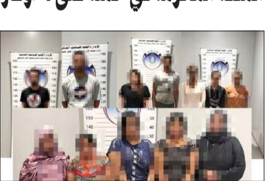
الموقوفون في الأوكار 9 نساء و3 رجال