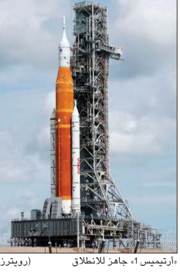
«أرتيميس 1» جاهز للانطلاق