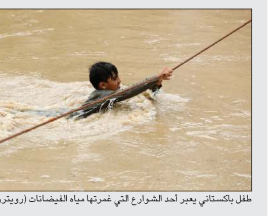
طفل باكستاني يعبر أحد الشوارع التي غمرتها مياه الفيضانات

إسلام آباد - (د.ب.أ). تسبب الفيضانات العارمة، الناجمة عن الأمطار الموسمية الغزيرة، في معظم أجزاء باكستان، في مقتل أكثر من ألف شخص وإصابة ونزوح آلاف آخرين. ونشرت صحيفة «ذا نيشن» الباكستانية أمس الأحد أن الفيضانات العارمة في إقليم «خبيز باختونخوا» تسببت في فيضان نهر كابل، مما أدى إلى عزل بعض المناطق.