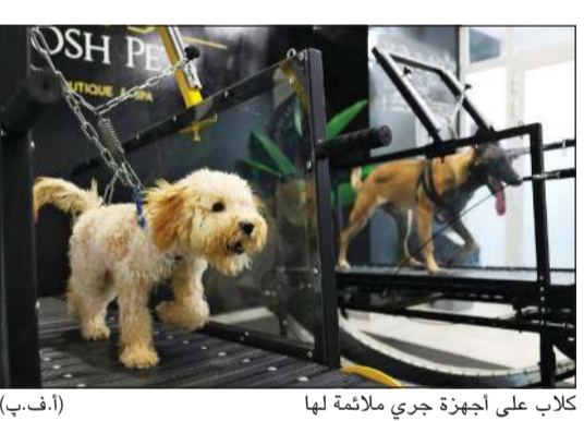
كلاب على أجهزة جري ملائمة لها

أبوظبي - أ.ف.ب. خلال فصل الصيف الذي تشهد فيه دولة الإمارات العربية المتحدة درجات حرارة مرتفعة ورطوبة عالية، تبقى الكلاب في منازل أصحابها الذين لا يبنونها في الخارج سوى لأوقات قصيرة جدا، لكن مبادرة جديدة في أبوظبي تسعى إلى توفير فرصة المشي لهذه الحيوانات الأليفة في صالة مكيفة. وبدء متجر متخصص بمستلزمات الحيوانات الأليفة وطعامها في العاصمة الإماراتية قبل شهرين بتوفير أجهزة جري ملائمة للكلاب للمرة الأولى في البلاد، في قاعة مبردة. ويتولى موظفون في المتجر وضع الكلب أوسكار البالغ عامين ونصف العام، وهو من فصيلة «ويلش كورغي»، على جهاز مشي، ويربطونه كي لا يقع.