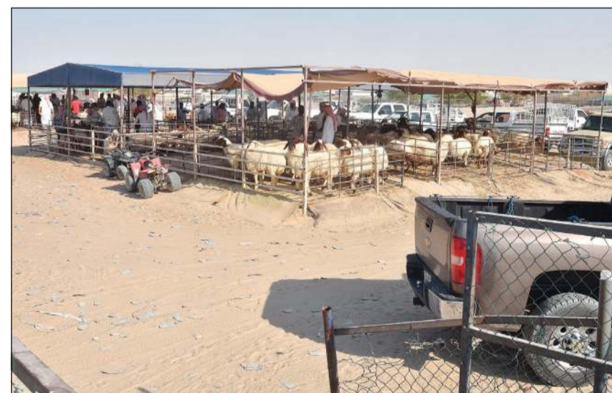
الاهتمام بالثروة الحيوانية ودعم مربيها من أهم أسس الأمن الغذائي

وهذا كله يضعف الإنتاج ويؤثر سلبي على موضوع الأمن الغذائي في البلاد، حيث ان الثروة الحيوانية ومنتجاتها المتنوعة من أهم أسسها.