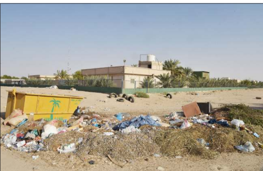
أحد الشوارع الداخلية.. حفر وقمامة ومخلفات