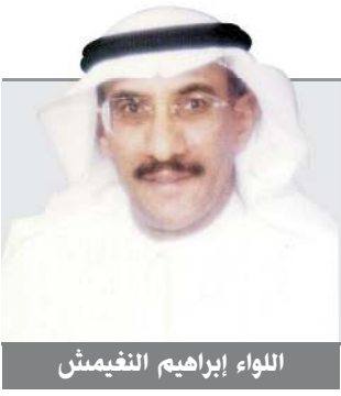
النواء إبراهيم النجمش

وإدارات للمرور والهجرة وغيرها. والآن جاء دور الوزارة بإعداد هؤلاء الموظفين لتولي وظائف الوزارة وخاصة للحاسب الآلي - فيجب تسليمهم الى الإدارة العامة للتدريب لإعداد الدورات الخاصة بهم حسب طلب كل إدارة تحتاج للموظفين.