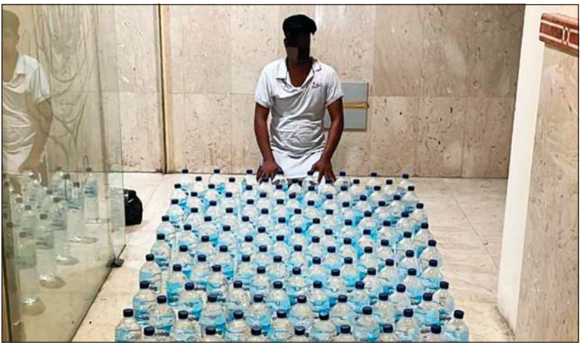
الوافد الآسيوي وأمامه المضبوطات من المواد المسكرة

الداخلية فإن رجال مباحث الأحمدى وصلت إليهم معلومات عن آسيوي اعتاد الاتجار في الخمور المحلية، وعليه تم عمل كمين وضبطه والعتور بحوزته على الخمور المحلية.