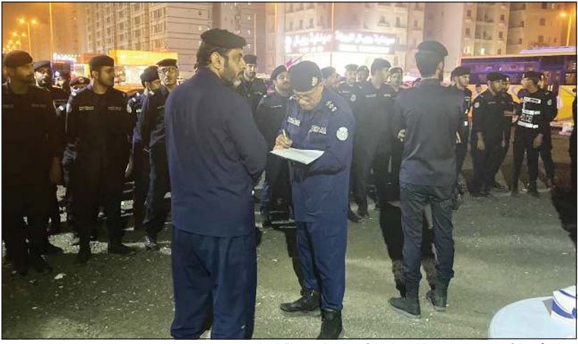
رجال أمن الأحمدى يضعون اللسعات الأخيرة على خطة التطويق

ان الحملة جاءت استمراراً للحملات التي وجه بإقامتها نائب رئيس مجلس الوزراء ووزير الدفاع ووزير الداخلية بالوكالة الشيخ طلال الخالد.