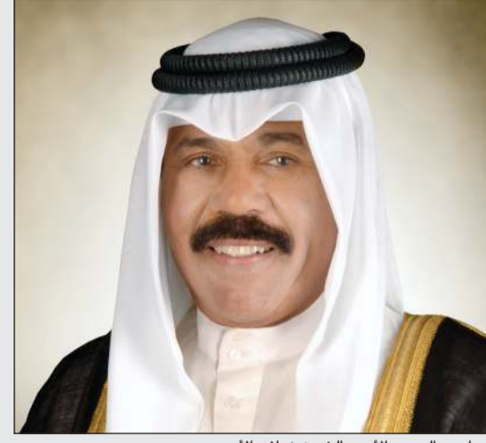
صاحب السمو الأمير الشيخ نواف الأحمد

بعث صاحب السمو الأمير الشيخ نواف الأحمد ببرقية تهنئة إلى الرئيسة كاتالين نوناف رئيسة هنجاريا الصديقة، عبر فيها سموه عن خالص تهانيسه بمناسبة العيد الوطني لبلادها، متمنيا سموه لها موفور الصحة والعافية ولهنغاريا وشعبها الصديق كل التقدم والازدهار.