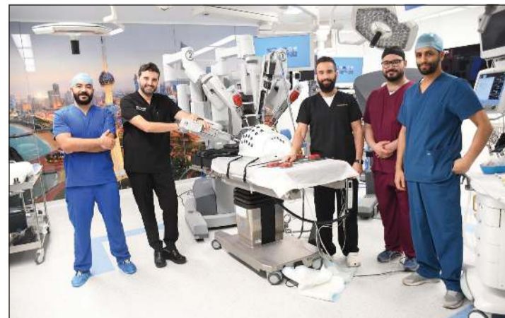
د.سليمان المزدي ود.ماهر الشعار مع فريق جراحة الروبوت

وأوضح أن هذا الانجاز يتماشى مع رؤية وزارة الصحة في تطوير المنظومة الصحية في الكويت وتقديم الرعاية المتميزة والأفضل علميا للمواطنين. من