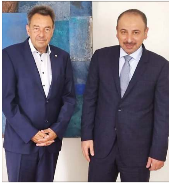
السفير ناصر الهين مع رئيس اللجنة الدولية للصليب الأحمر بيتر ماورر

جنييف - كونا: أكد مندوبا الدائم لدى الأمم المتحدة والمنظمات الدولية الأخرى في جنيف السفير ناصر الهين حرص الكويت على تعزيز علاقاتها مع المنظمات الإنسانية الدولية، لاسيما اللجنة الدولية للصليب الأحمر. وقال السفير الهين في تصريح لـ «كونا» عقب لقاء مع رئيس اللجنة الدولية للصليب الأحمر بيتر ماورر بمقر اللجنة بمدينة جنيف إن اللقاء جاء تعزيزا للعمل الإنساني واستجابة للدور الحيوي الذي تقوم به الدولة نصرة لشعوب العالم وتخفيفا لمعاناتها جراء الأزمات الدولية. وأضاف أن اجتماعه مع