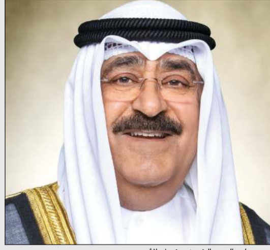
سمو ولي العهد الشيخ مشعل الأحمد

بعث سمو ولي العهد الشيخ مشعل الأحمد ببرقية تهنئة إلى الرئيسة كاتالين نوناف رئيسة هنجاريا الصديقة، ضمنها سموه خالص تهانيسه بمناسبة العيد الوطني لبلادها، راجيا لها وافر الصحة والعافية.