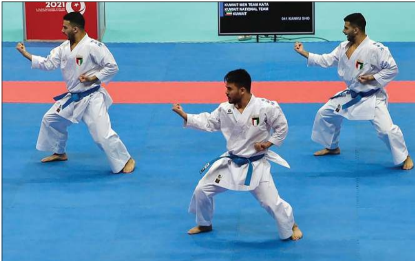
أزرق الكراتيه ظهر بمستوى جيد وحقق فضية كاتا - فرق