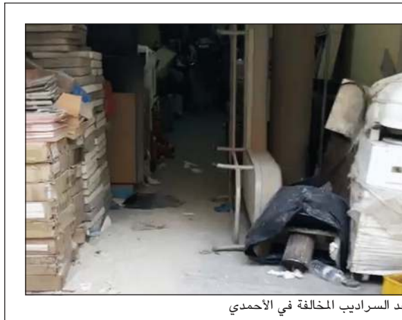
أحد السراديب المخالفة في الأحمدية