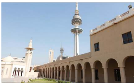
قصر نايف يحتوي على عدد من الأروقة والمعالم التراثية

شاهدا على روعة المعمار في الكويت خلال الربع الأول من القرن العشرين «بأسواره العالية وأبوابه الخشبية وساحتها الكبيرة وأقواسه التي تزين المكان وتتبع منه الحياة لاسيما في شهر رمضان الكريم من خلال إحياء تقاليد مدفع الإفطار». وقال إن فكرة إدراج قصر نايف على قائمة التراث في العالم الإسلامي تم طرحها على الشيخ طلال الخالد عندما كان محافظاً للعاصمة والذي بدوره رحب بالفكرة وقدم الدعم ليأخذ قصر نايف موقعه في خريطة التراث في العالم الإسلامي. وأفاد السيف بأن عدد أعضاء لجنة التراث في العالم الإسلامي هي تسع دول إسلامية من بينها ثلاث عربية وثلاث أفريقية وثلاث آسيوية ويتم انتخابها من وزراء الثقافة في الدول الإسلامية البالغ عددها 54 دولة. وأشار إلى أن من بين أهداف اللجنة توثيق وحماية المواقع التاريخية والأثرية والطبيعية في الدول الإسلامية من خلال إدراجها على قائمة التراث في