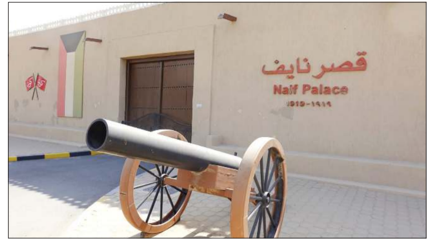
مدفع بوابة قصر نايف

يروى عقب التاريخ الكويتي بكل صور ومعاني الثبات والشموخ.. ويرجع تاريخه إلى ما يزيد على 100 عام إذ بدأ بناؤه عام 1919 وأنجز في 1920