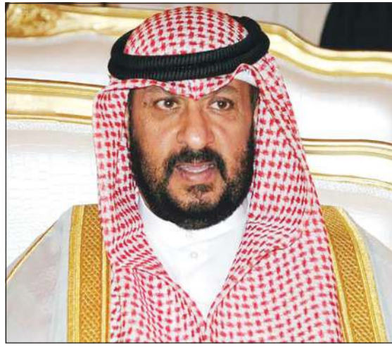
الشيخ طلال الخالد