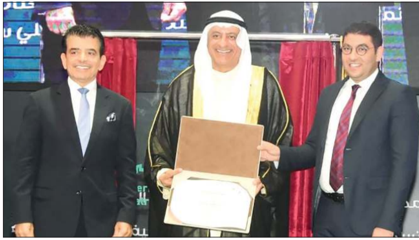
د.وليد السيف مع وزير الشباب والثقافة الغربي د.محمد المهدي بنسعيد ومدير عام منظمة الايسيسكو د.سامح بن محمد الملك